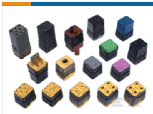
TE 产品编号ZPF000000000148762 DMC-M 99-04 AN (=33537-P0000)