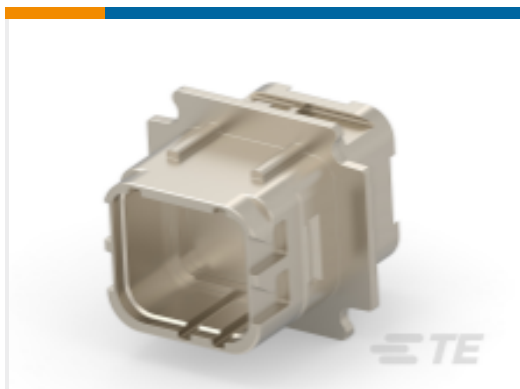
TE 产品编号ZPF000000000146309 Rectangular Connector Receptacle Extenders, Tool-less Assembly