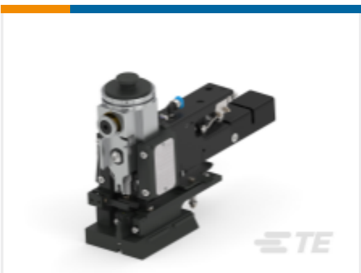
TE 产品编号2150769-1 OCEAN_2.0_Applicator-E-070F140F- REM