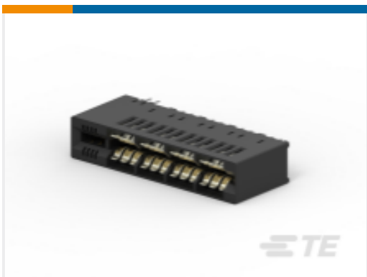
TE 产品编号2214913-5 MULTI-BEAM CE 2X4 P + 2X4 S VERTICAL