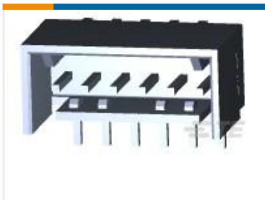
TE 产品编号2-644489-6 06P MTA100 SHRD HDR R/A 30AU L