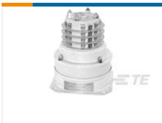
TE 产品编号1-1393139-3 MDR-141-1=MDR