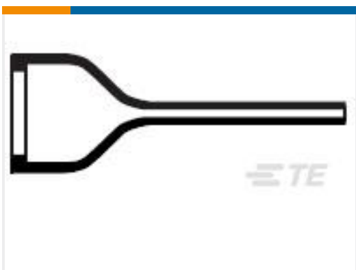
TE 产品编号564776-000 202D921-3-05-0