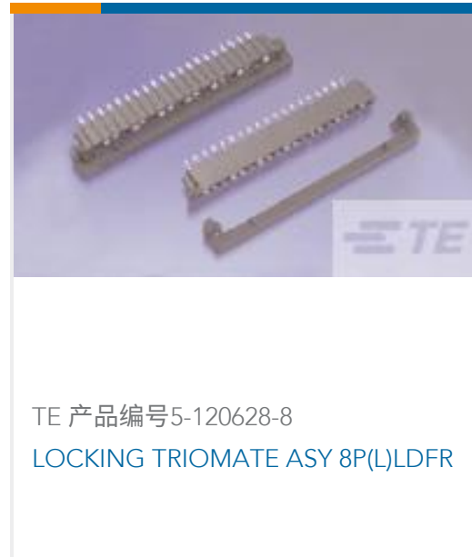
TE 产品编号5-120628-8 LOCKING TRIOMATE ASY 8P(L)LDFFR