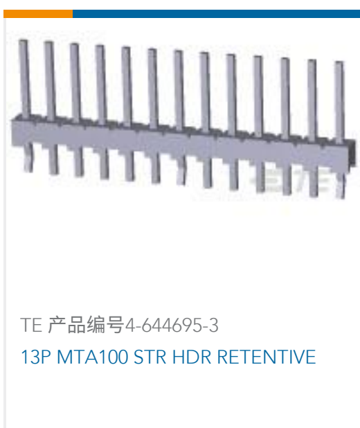
TE 产品编号4-644695-3 13P MTA100 STR HDR RETENTIVE