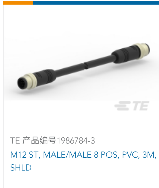
TE 产品编号1986784-3 M12 ST, MALE/MALE 8 POS, PVC, 3M, SHLD