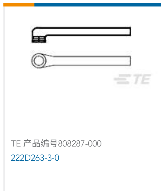
TE 产品编号808287-000 222D263-3-0