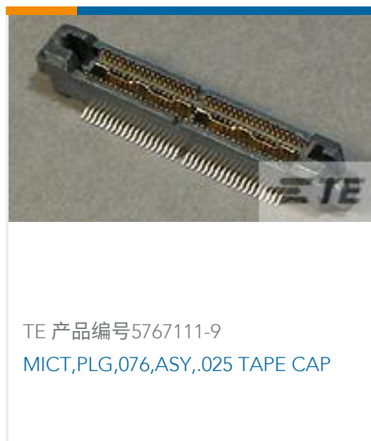
TE 产品编号5767111-9 MICT,PLG,076,ASY,.025 TAPE CAP