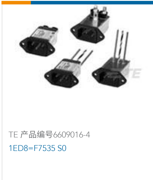
TE 产品编号6609016-4 1ED8=F7535 S0