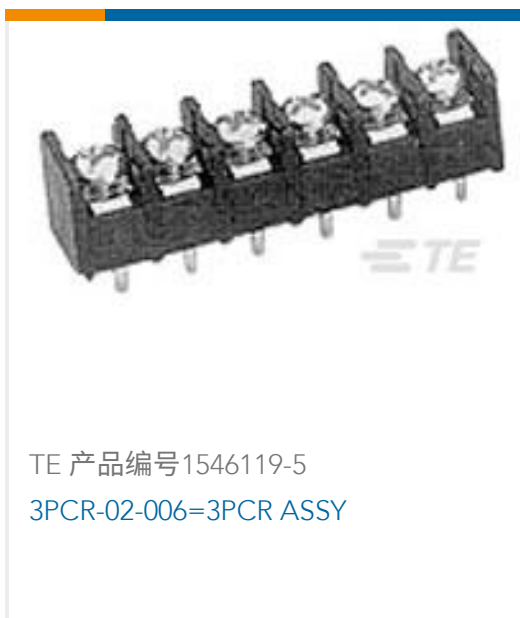
TE 产品编号1546119-5 3PCR-02-006=3PCR ASSY