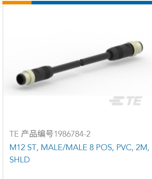
TE 产品编号1986784-2 M12 ST, MALE/MALE 8 POS, PVC, 2M, SHLD