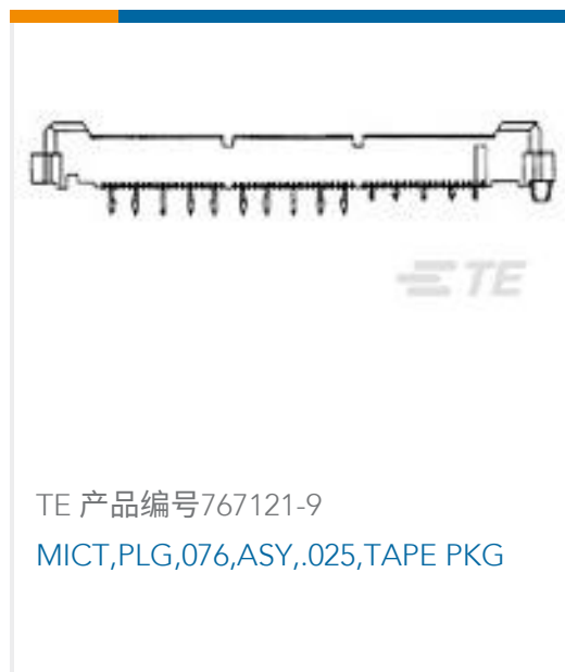
TE 产品编号767121-9 MICT,PLG,076,ASY,.025,TAPE PKG