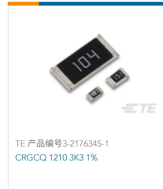
TE 产品编号3-2176345-1 CRGCO 1210 3K3 1%