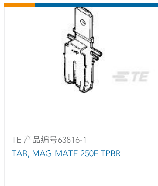
TE 产品编号63816-1 TAB, MAG-MATE 250F TPBR