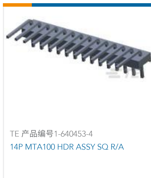
TE 产品编号1-640453-4 14P MTA100 HDR ASSY SQ R/A