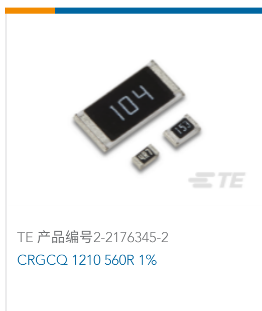
TE 产品编号2-2176345-2 CRGCO 1210 560R 1%