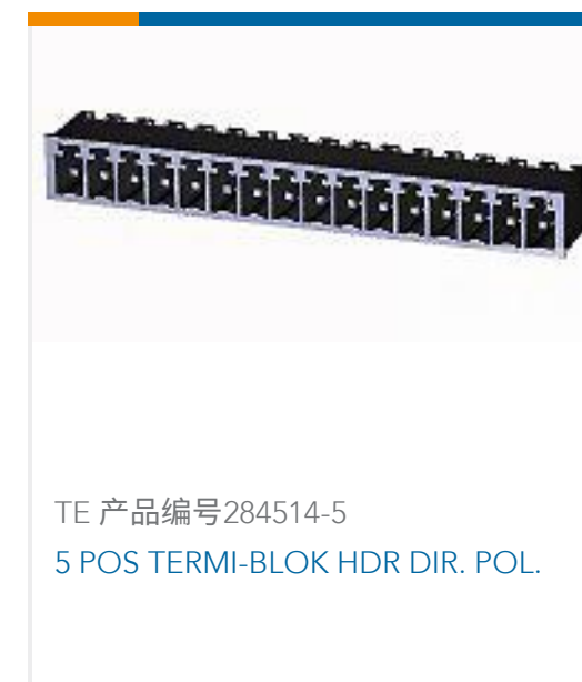
TE 产品编号284514-5 5 POS TERMI-BLOK HDR DIR. POL.