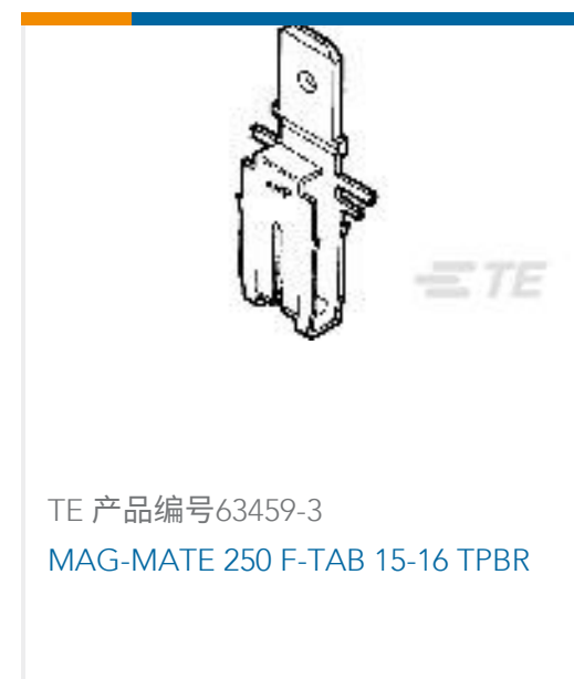
TE 产品编号63459-3 MAG-MATE 250 F-TAB 15-16 TPBR