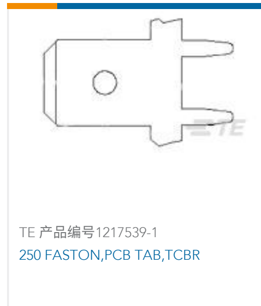
TE 产品编号1217539-1 250 FASTON, PCB TAB, TCBR