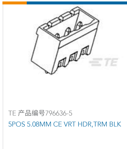
TE 产品编号796636-5 5POS 5.08MM CE VRT HDR, TRM BLK