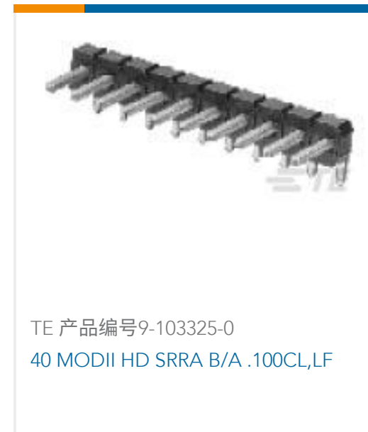
TE 产品编号9-103325-0 40 MODII HD SRRA B/A .100CL, LF