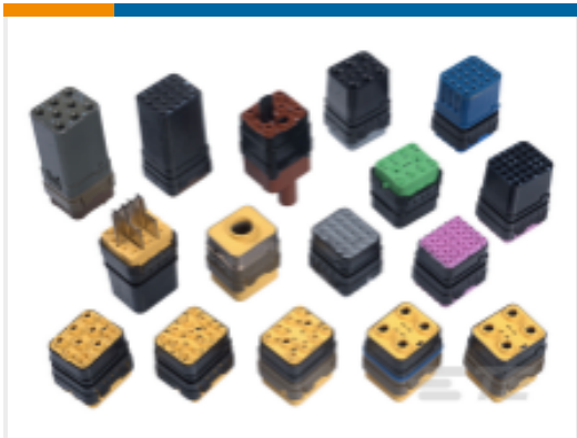
TE 产品编号ZPF00000000148762 DMC-M 99-04 AN (=33537-P0000)