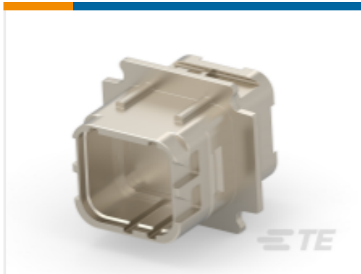
TE 产品编号ZPF00000000146309 Rectangular Connector Receptacle Extenders, Tool-less Assembly