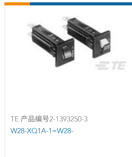
TE 产品编号2-1393250-3 W28-XQ1A-1=W28-