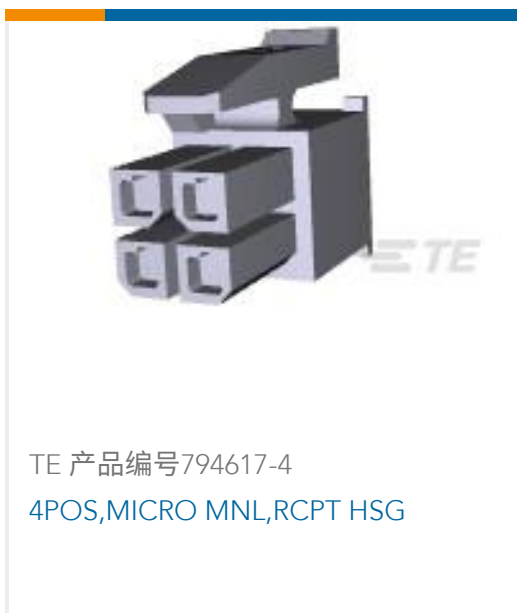
TE 产品编号794617-4 4POS,MICRO MNL,RCPT HSG