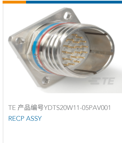
TE 产品编号YDTS20W11-05PAV001 RECP ASSY