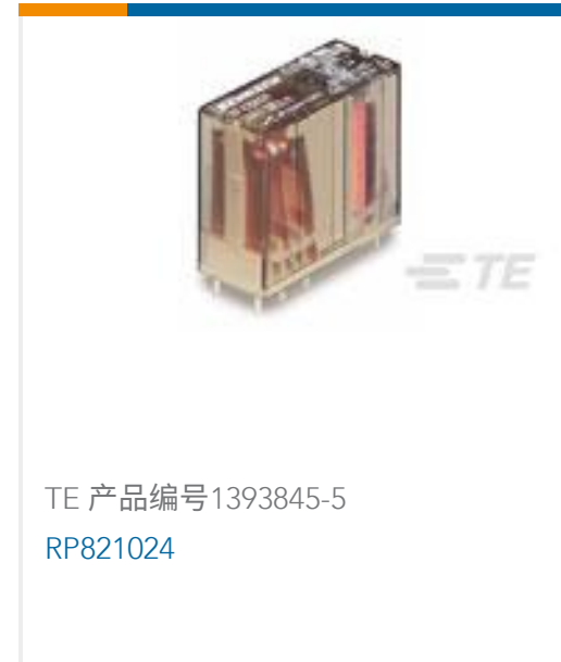
TE 产品编号1393845-5 RP821024