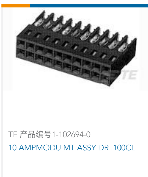
TE 产品编号1-102694-0 10 AMPMODU MT ASSY DR .100CL