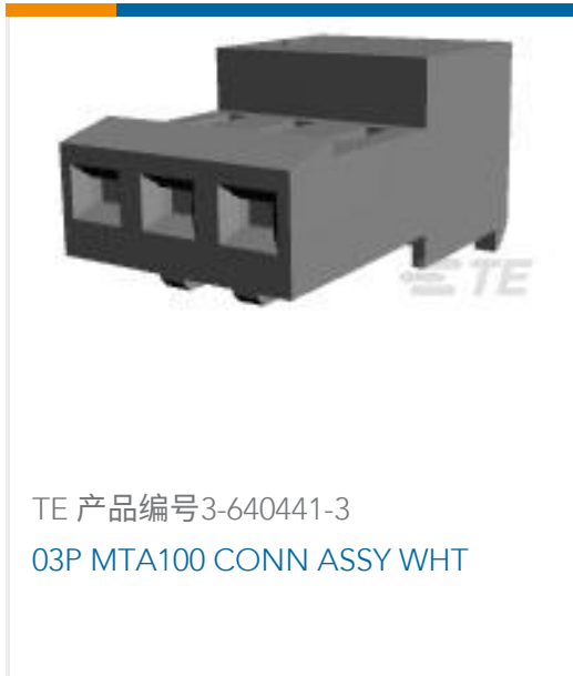
TE 产品编号3-640441-3 03P MTA100 CONN ASSY WHT