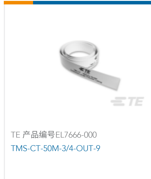
TE 产品编号EL7666-000 TMS-CT-50M-3/4-OUT-9