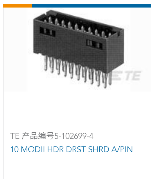
TE 产品编号5-102699-4 10 MODII HDR DRST SHRD A/PIN