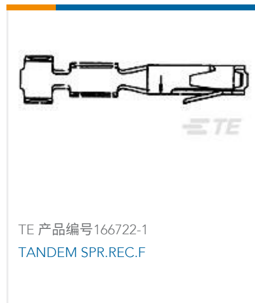
TE 产品编号166722-1 TANDEM SPR.REC.F