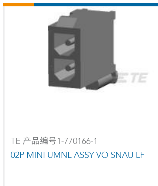
TE 产品编号1-770166-1 02P MINI UMNL ASSY VO SNAU LF