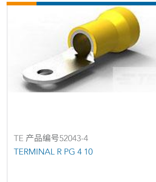
TE 产品编号52043-4 TERMINAL R PG 4 10