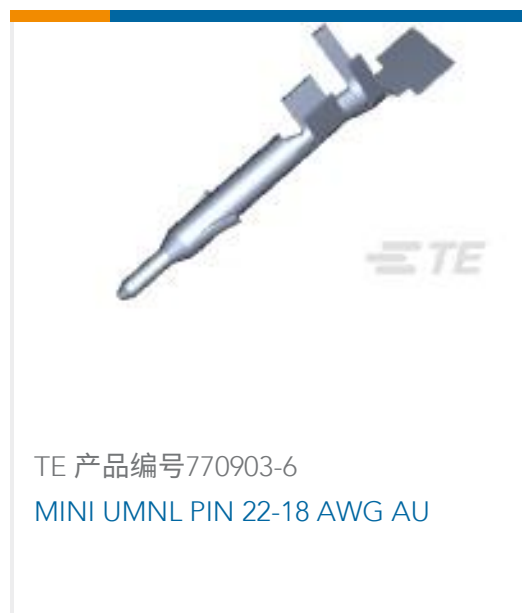
TE 产品编号770903-6 MINI UMNL PIN 22-18 AWG AU