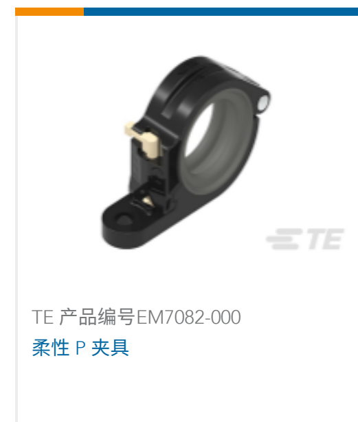
TE 产品编号EM7082-000 柔性 P 夹具