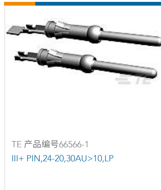
TE 产品编号66566-1 III+ PIN,24-20,30AU>10,LP