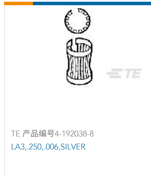
TE 产品编号4-192038-8 LA3,.250,.006,SILVER