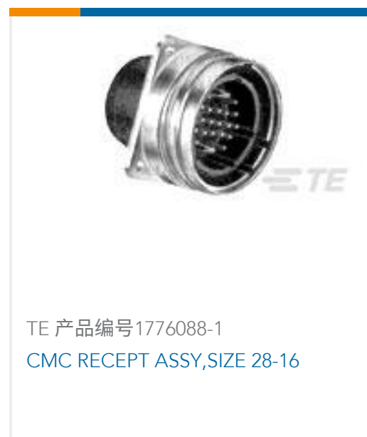
TE 产品编号1776088-1 CMC RECEPT ASSY,SIZE 28-16