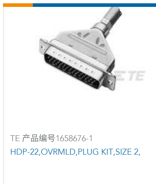
TE 产品编号1658676-1 HDP-22,OVRMLD,PLUG KIT,SIZE 2,