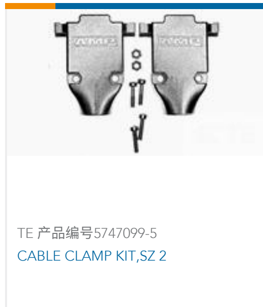
TE 产品编号5747099-5 CABLE CLAMP KIT,SZ 2