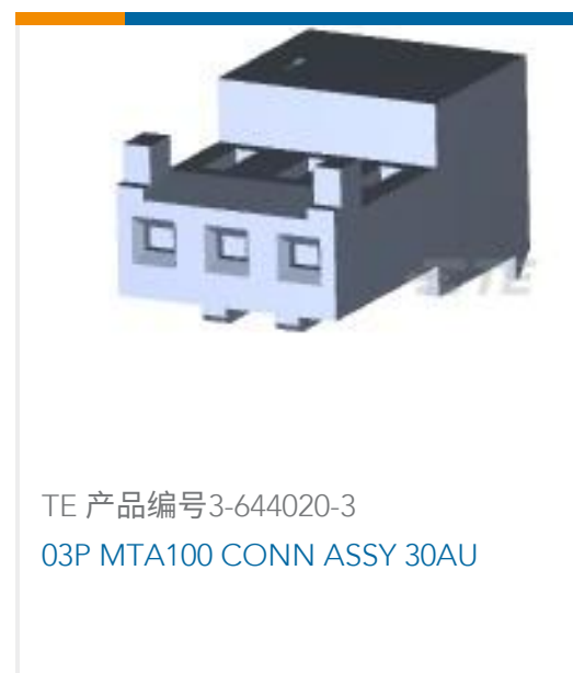
TE 产品编号3-644020-3 03P MTA100 CONN ASSY 30AU