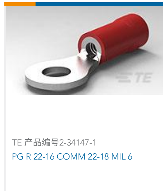
TE 产品编号2-34147-1 PG R 22-16 COMM 22-18 MIL 6