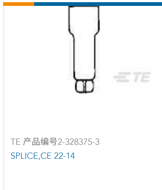
TE 产品编号2-328375-3 SPLICE,CE 22-14