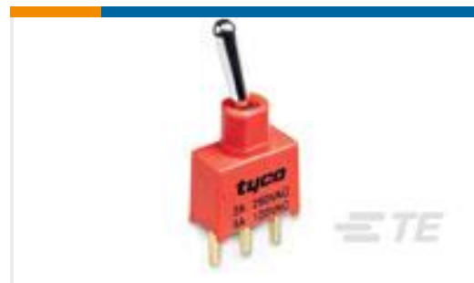
TE 产品编号2-1825143-2 AE205SD1CQ04