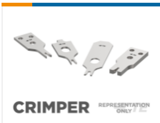
TE 产品编号6-1633962-1 CRIMPER, INSULATION F PREMIUM