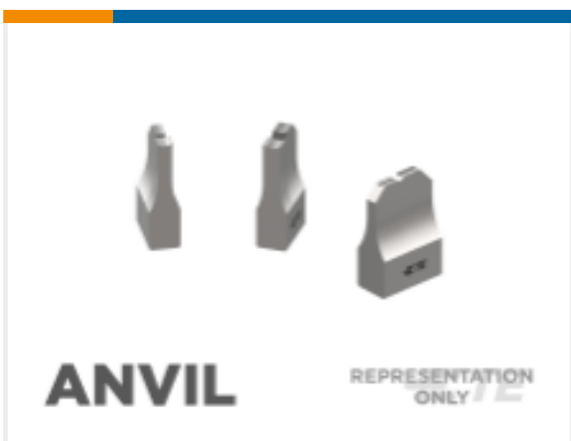
TE 产品编号8-1633927-0 ANVIL, COMBINATION