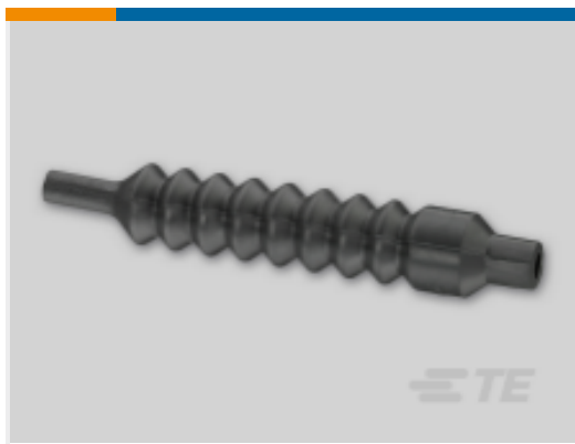
TE 产品编号D20276-000 202G611-780-0