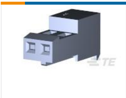
TE 产品编号3-641193-2 02P MTA100 CONN ASSY GRN LF