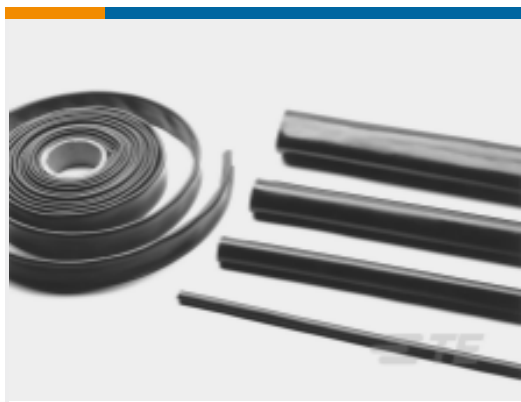
TE 产品编号F69019-000 RT-780-1/4-0-SP