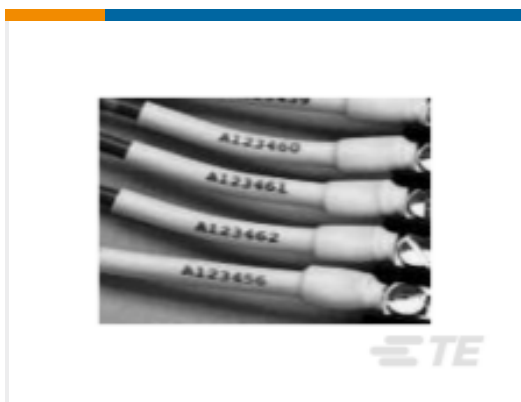
TE 产品编号EE1123-000 CPGI-RNF-100-1/2-0-3IN