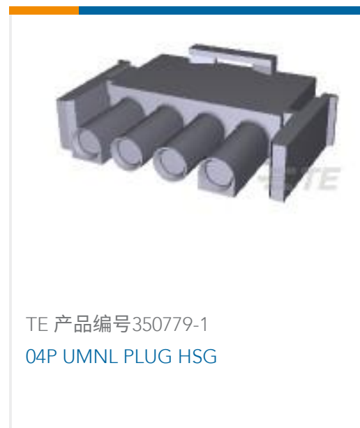
TE 产品编号350779-1 04P UMNL PLUG HSG