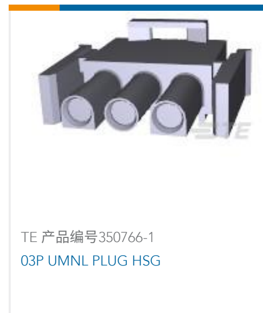
TE 产品编号350766-1 03P UMNL PLUG HSG