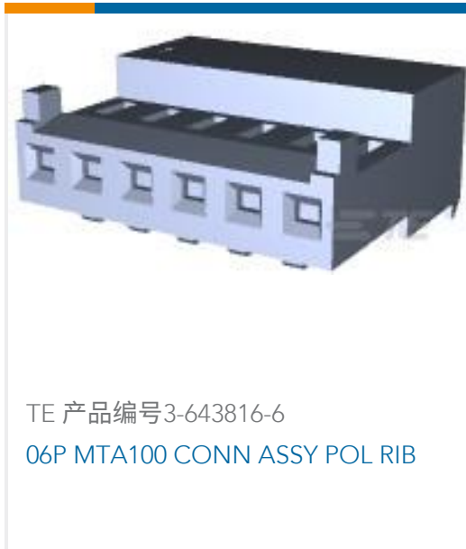
TE 产品编号3-643816-6 06P MTA100 CONN ASSY POL RIB