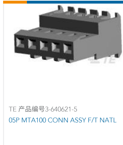
TE 产品编号3-640621-5 05P MTA100 CONN ASSY F/T NATL