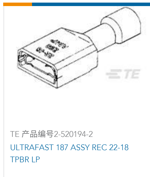
TE 产品编号2-520194-2 ULTRAFast 187 ASSY REC 22-18 TPBR LP