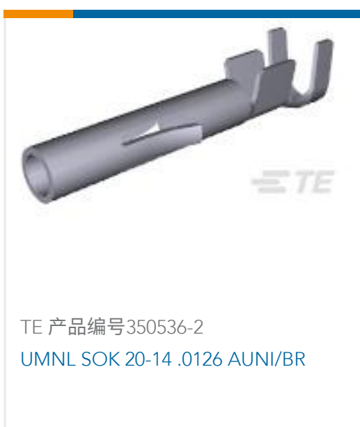
TE 产品编号350536-2 UMNL SOK 20-14 .0126 AUNI/BR