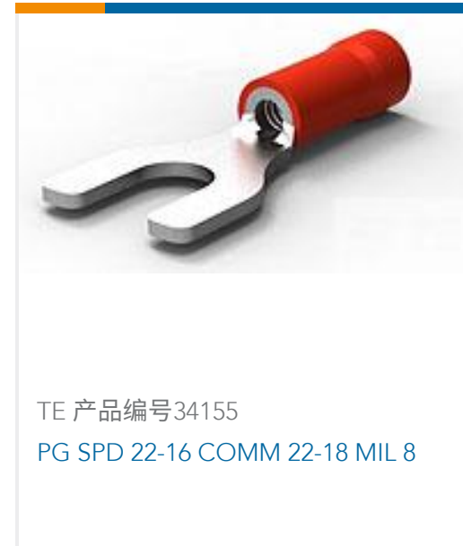
TE 产品编号34155 PG SPD 22-16 COMM 22-18 MIL 8