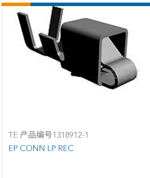
TE 产品编号1318912-1 EP CONN LP REC