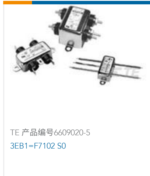
TE 产品编号6609020-5 3EB1=F7102 S0