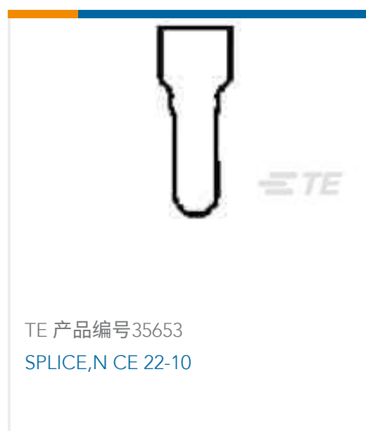
TE 产品编号35653 SPLICE,N CE 22-10