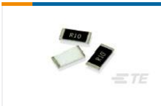
TE 产品编号2176050-3 RLP73M 1E R062 5% 5K RL