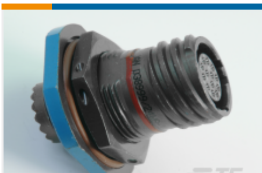
TE 产品编号YDTS24W17-06PAC001 RECP ASSY