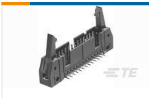
TE 产品编号1-499786-2 064 UNIV HDR RA 4S 15DP STD L1