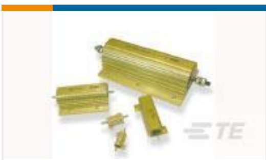
TE 产品编号1625980-6 HSX25 R22 5%