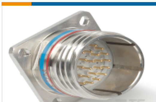
TE 产品编号YDTS20W25-04BAV001 RECP ASSY