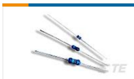
TE 产品编号1622600-1 LR1L 5% R22