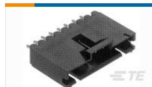
TE 产品编号5-103669-3 04 MTE HDR SRST LATCH W/HLDWN