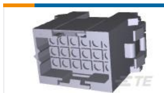
TE 产品编号207443-1 HSG RECEPT,18 POSN,SM METRIC