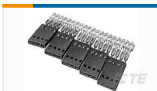
TE 产品编号103648-3 04 MTE RCPT HSG SR RIB .100CL