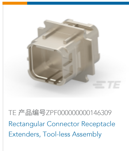
TE 产品编号ZPF000000000146309 Rectangular Connector Receptacle Extenders, Tool-less Assembly