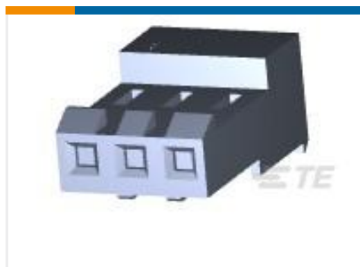
TE 产品编号3-640428-3 03P MTA156 CONN ASSY 22AWG RED