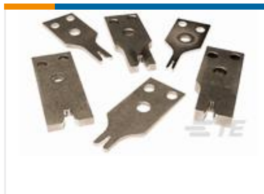
TE 产品编号1-456406-2 CRIMPER WIRE .090 F