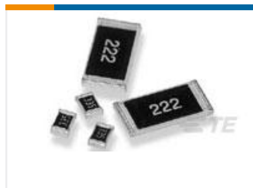
TE 产品编号1622829-1 CRG0603 1% 10K