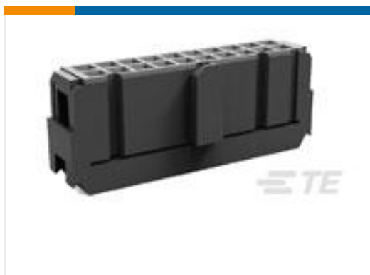
TE 产品编号1658621-2 14 NOVO MIL/CTR 15DP,LEAD FREE