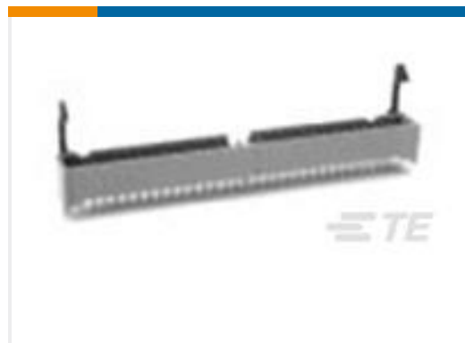
TE 产品编号2-1761713-3 IDC LOW PRO HDR 10P VERT SHT L