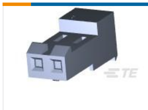
TE 产品编号3-640428-2 02P MTA156 CONN ASSY 22AWG RED