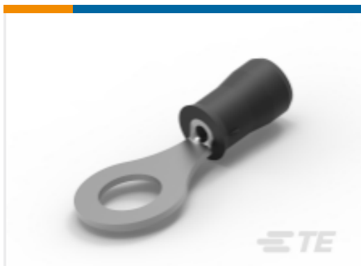
TE 产品编号320569 PIDG Ring Tongue Terminals