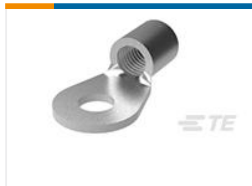
TE 产品编号36925 TERMINAL,SOLIS R 2/0 1/2