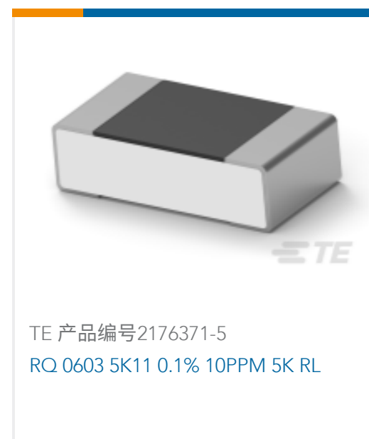
TE 产品编号2176371-5 RQ 0603 5K11 0.1% 10PPM 5K RL