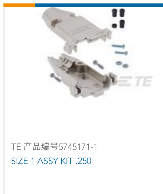
TE 产品编号5745171-1 SIZE 1 ASSY KIT .250