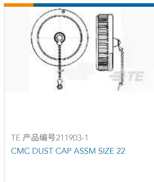
TE 产品编号211903-1 CMC DUST CAP ASSM SIZE 22