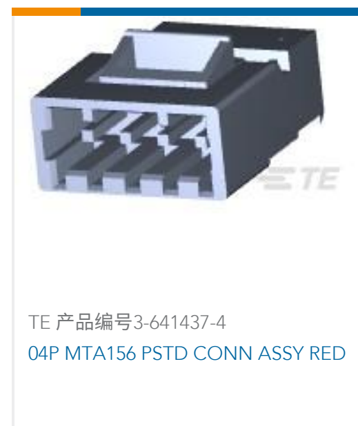
TE 产品编号3-641437-4 04P MTA156 PSTD CONN ASSY RED