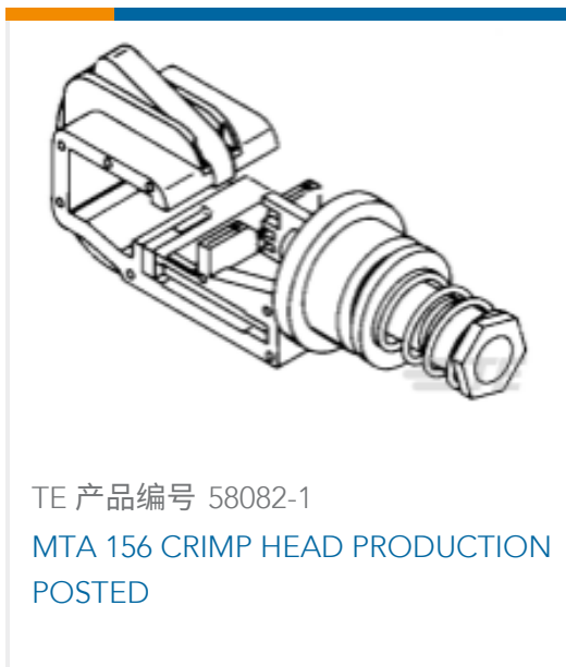
TE 产品编号 58082-1 MTA 156 CRIMP HEAD PRODUCTION POSTED