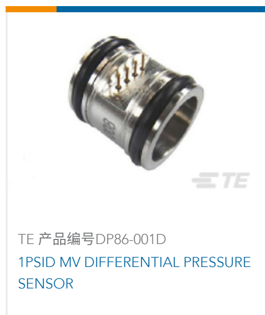
TE 产品编号DP86-001D 1PSID MV DIFFERENTIAL PRESSURE SENSOR