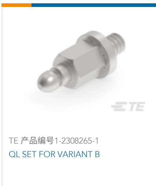
TE 产品编号1-2308265-1 QL SET FOR VARIANT B