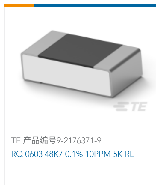
TE 产品编号9-2176371-9 RQ 0603 48K7 0.1% 10PPM 5K RL