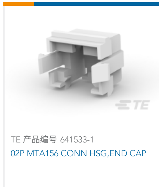
TE 产品编号 641533-1 02P MTA156 CONN HSG, END CAP POSTED