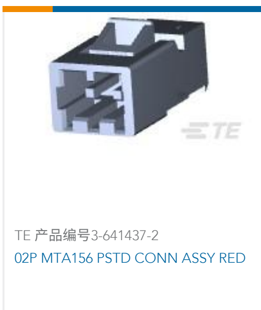
TE 产品编号3-641437-2 02P MTA156 PSTD CONN ASSY RED