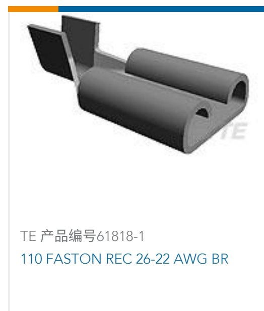
TE 产品编号61818-1 110 FASTON REC 26-22 AWG BR