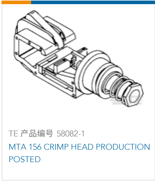
TE 产品编号 58082-1 MTA 156 CRIMP HEAD PRODUCTION POSTED