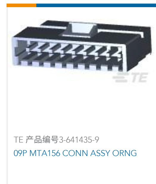
TE 产品编号3-641435-9 09P MTA156 CONN ASSY ORNG