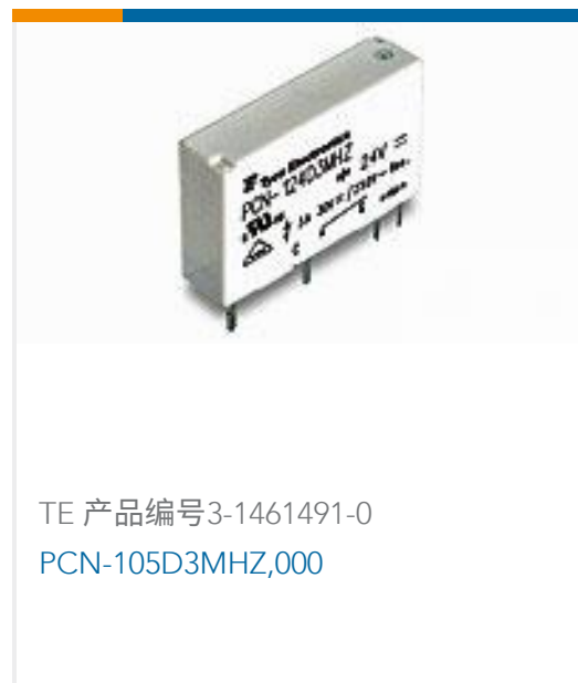
TE 产品编号3-1461491-0 PCN-105D3MHZ,000