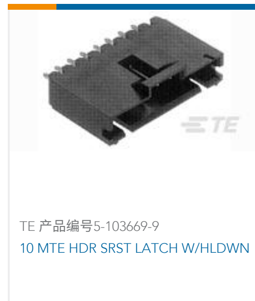
TE 产品编号5-103669-9 10 MTE HDR SRST LATCH W/HLDWN