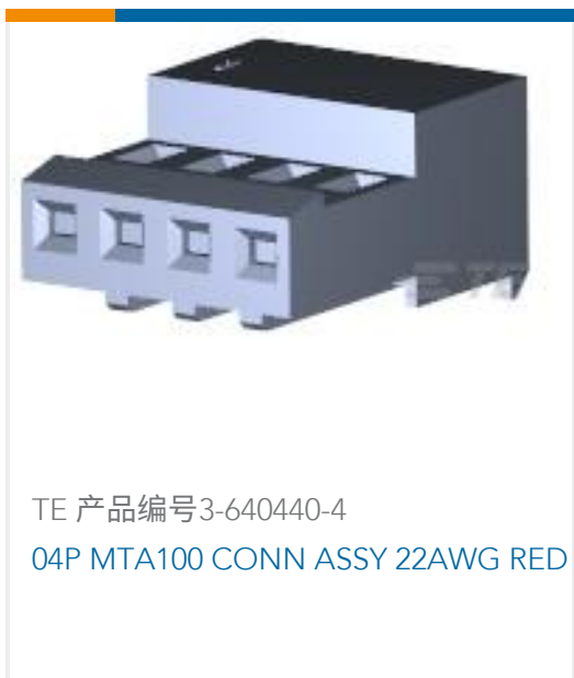
TE 产品编号3-640440-4 04P MTA100 CONN ASSY 22AWG RED