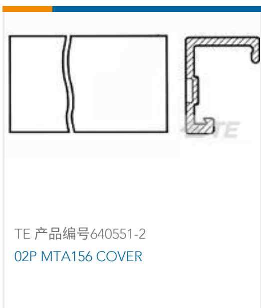
TE 产品编号640551-2 02P MTA156 COVER