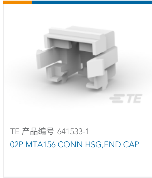
TE 产品编号 641533-1 02P MTA156 CONN HSG, END CAP POSTED