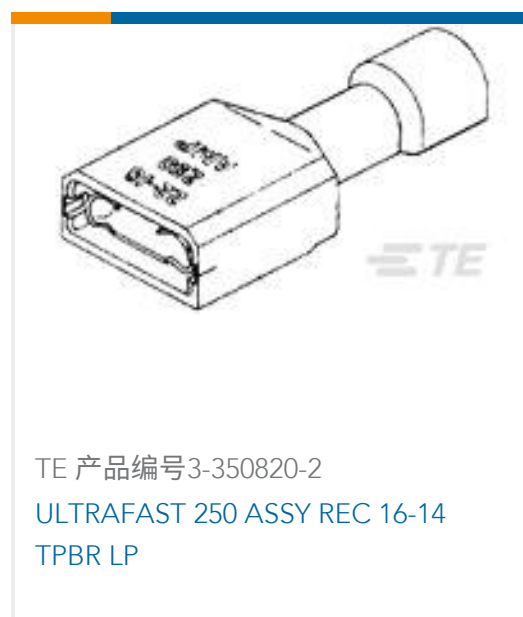
TE 产品编号3-350820-2 ULTRAFast 250 ASSY REC 16-14 TPBR LP