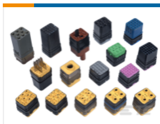
TE 产品编号ZPF000000000148762 DMC-M 99-04 AN (=33537-P0000)