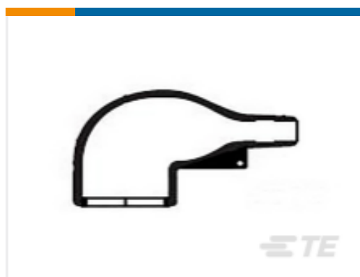
TE 产品编号EF9981-000 222K121-25L/225-0