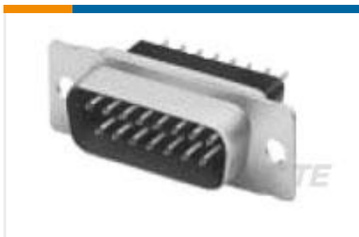
TE 产品编号5749014-1 9 PLUG W/INDENTS & C NUTS