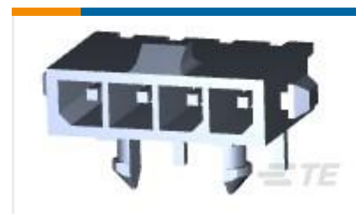
TE 产品编号2-1445055-4 MICRO MNL HDR ASSY S/ROW LF