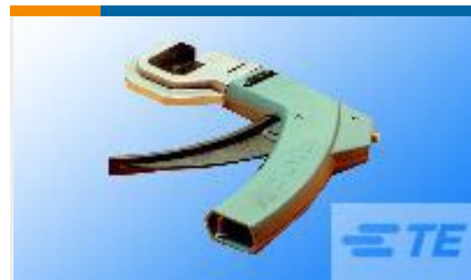
TE 产品编号58579-1 MTA 100 MANUAL TOOL ASSEMBLY DISCRETE