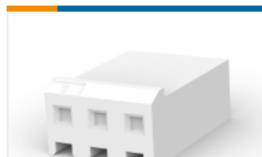
TE 产品编号770849-7 Receptacle Housing: Wire-to-Board, with Mating Alignment, SL156