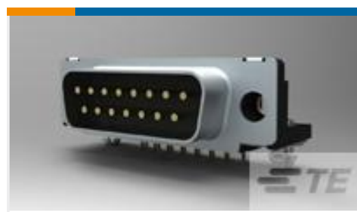
TE 产品编号5747841-4 15 MSFL PLUG RA 318 (IN,FM,BL)