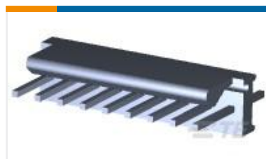
TE 产品编号640456-9 09P MTA100 HDR ASSY F/L SQ STR