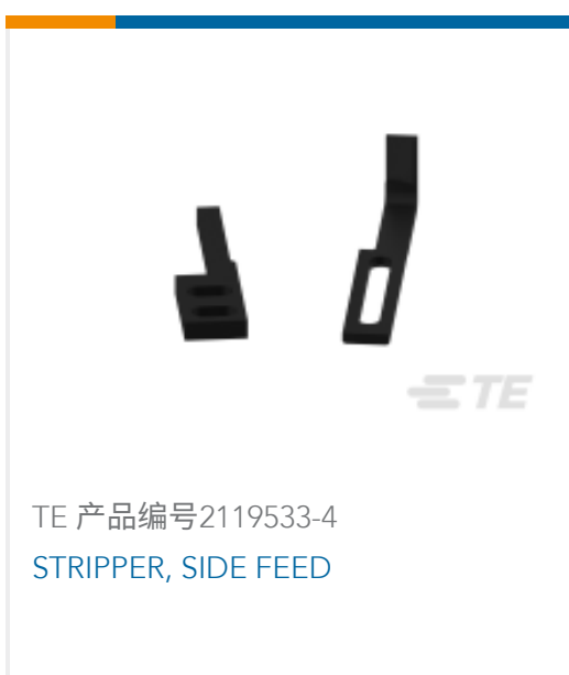
TE 产品编号2119533-4 STRIPPER, SIDE FEED