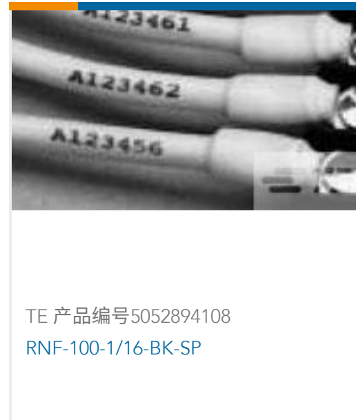
TE 产品编号5052894108 RNF-100-1/16-BK-SP