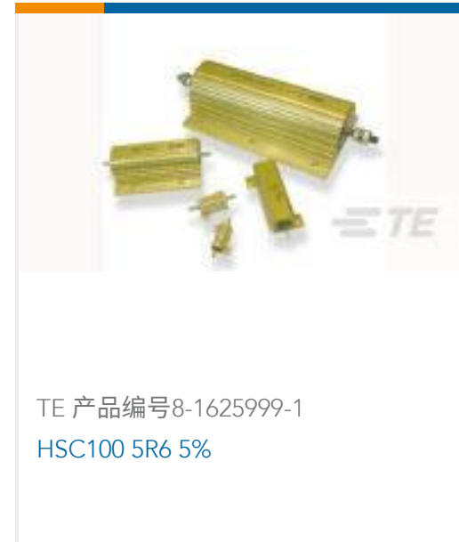
TE 产品编号8-1625999-1 HSC100 5R6 5%