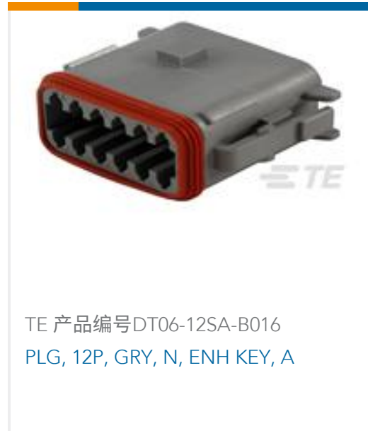
TE 产品编号DT06-12SA-B016 PLG, 12P, GRY, N, ENH KEY, A