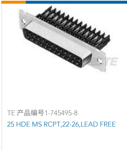
TE 产品编号1-745495-8 25 HDE MS RCPT,22-26,LEAD FREE