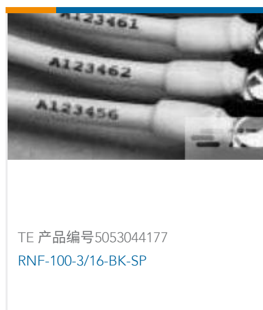
TE 产品编号5053044177 RNF-100-3/16-BK-SP