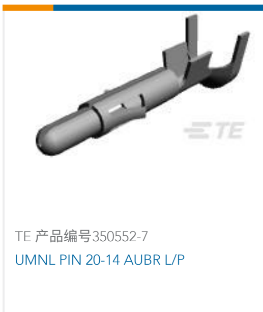
TE 产品编号350552-7 UMNL PIN 20-14 AUBR L/P