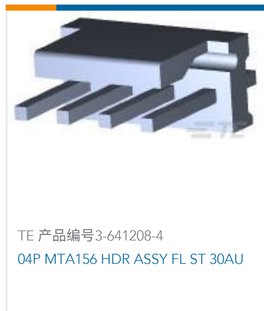
TE 产品编号3-641208-4 04P MTA156 HDR ASSY FL ST 30AU