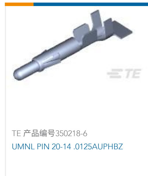
TE 产品编号350218-6 UMNL PIN 20-14 .0125AUPHBZ