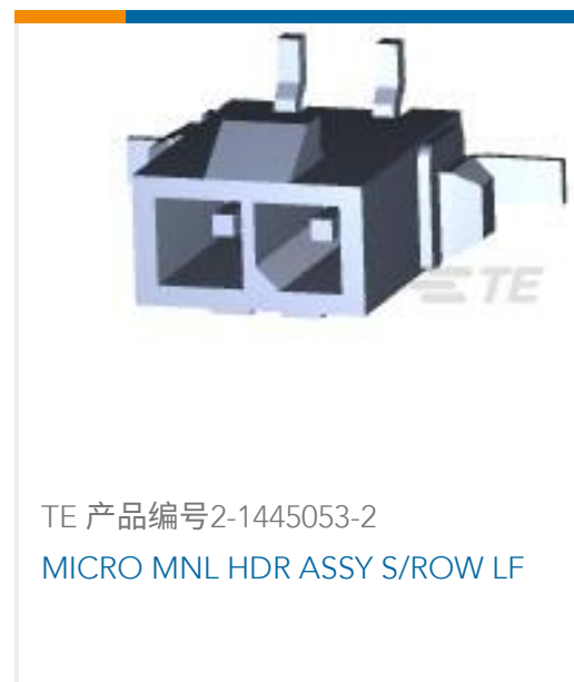
TE 产品编号2-1445053-2 MICRO MNL HDR ASSY S/ROW LF