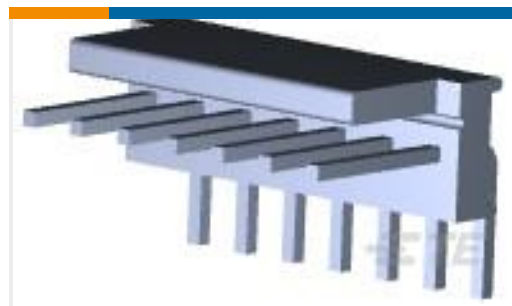
TE 产品编号3-641214-7 07P MTA100 HDR ASSY PO/RA LF