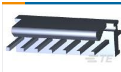
TE 产品编号3-641126-7 07P MTA100 HDR ASY FL/STR LF