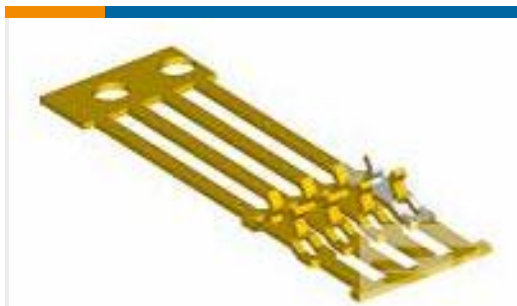
TE 产品编号1544256-1 CONTACT A SOUDER