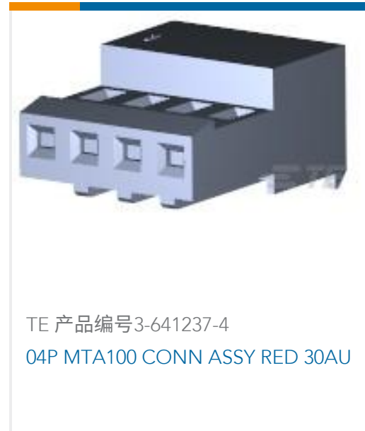
TE 产品编号3-641237-4 04P MTA100 CONN ASSY RED 30AU