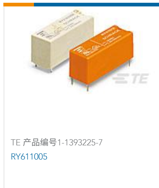
TE 产品编号1-1393225-7 RY611005