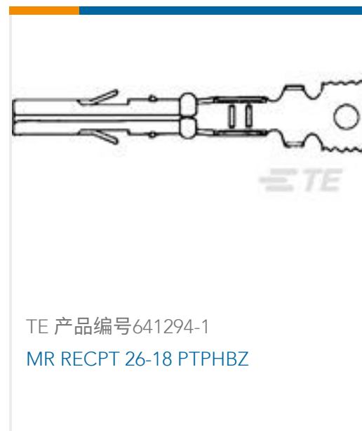
TE 产品编号641294-1 MR RECPT 26-18 PTPHBZ