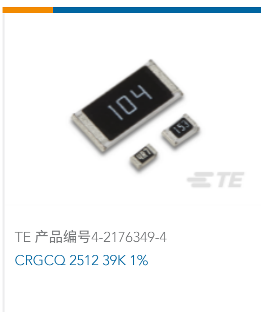
TE 产品编号4-2176349-4 CRGCO 2512 39K 1%