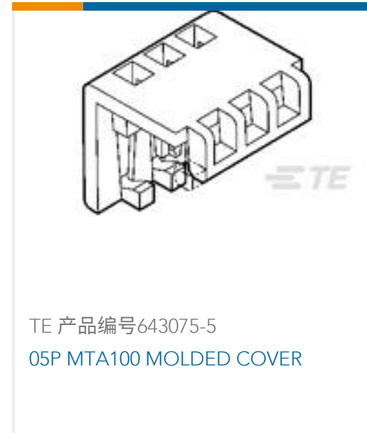
TE 产品编号643075-5 05P MTA100 MOLDED COVER