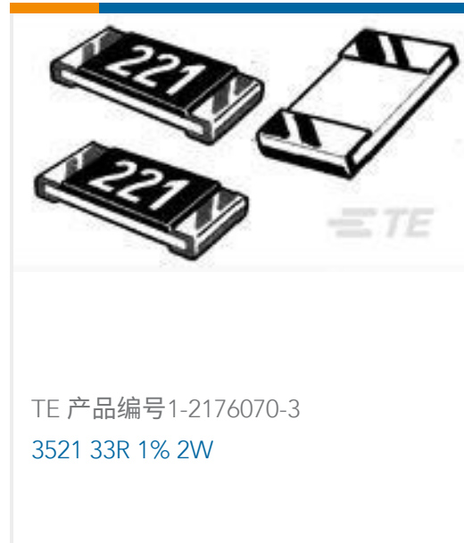
TE 产品编号1-2176070-3 3521 33R 1% 2W