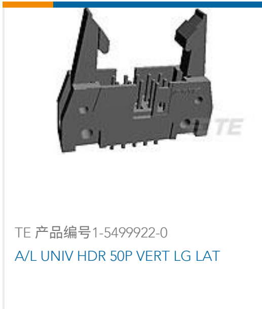
TE 产品编号1-5499922-0 A/L UNIV HDR 50P VERT LG LAT