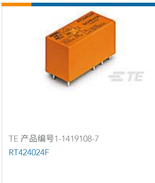
TE 产品编号1-1419108-7 RT424024F