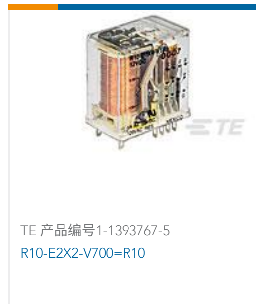
TE 产品编号1-1393767-5 R10-E2X2-V700=R10