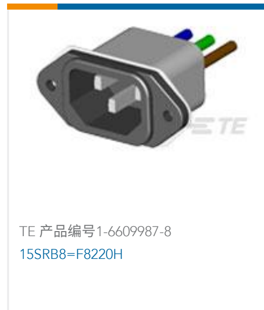
TE 产品编号1-6609987-8 15SRB8=F8220H