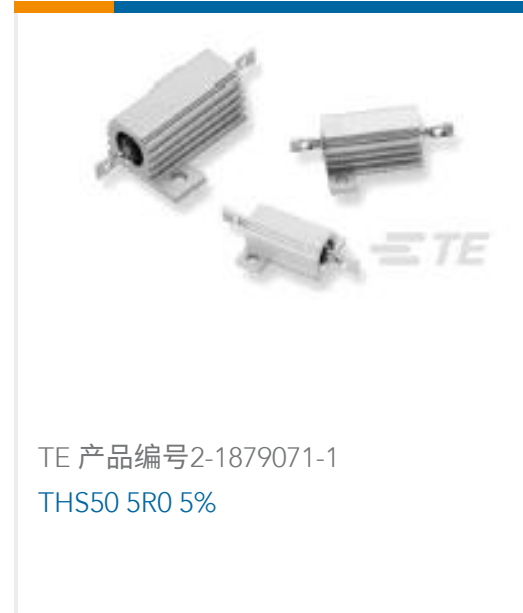
TE 产品编号2-1879071-1 THS50 5R0 5%