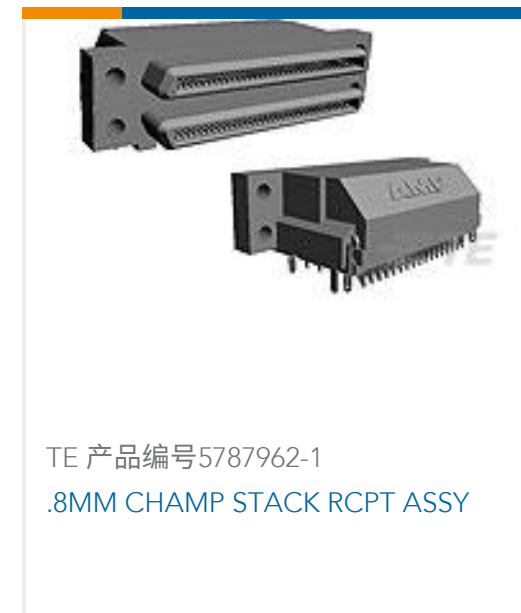
TE 产品编号5787962-1 .8MM CHAMP STACK RCPT ASSY