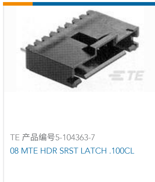
TE 产品编号5-104363-7 08 MTE HDR SRST LATCH .100CL