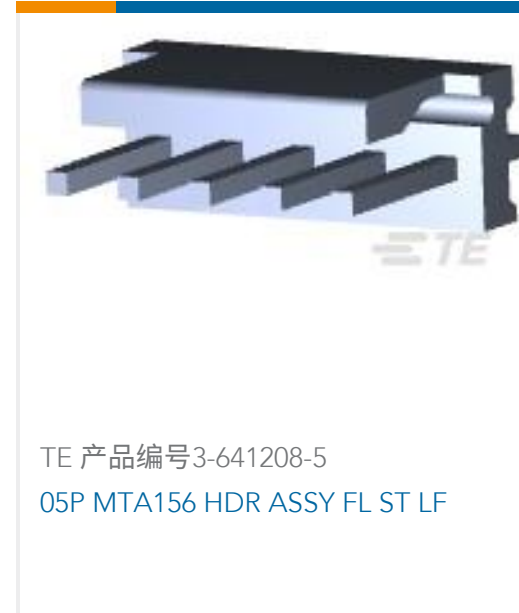
TE 产品编号3-641208-5 05P MTA156 HDR ASSY FL ST LF