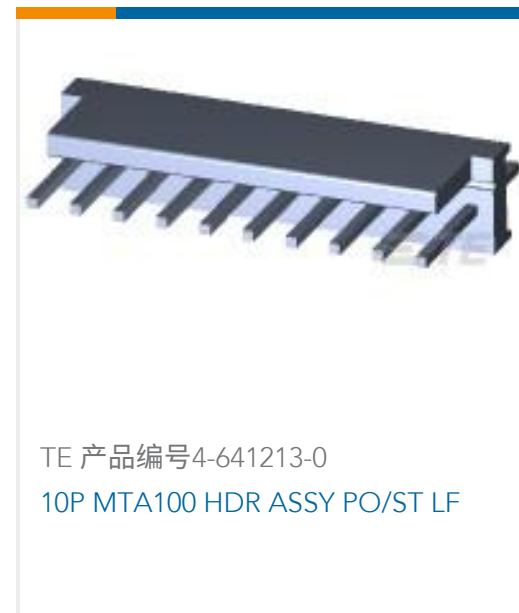
TE 产品编号4-641213-0 10P MTA100 HDR ASSY PO/ST LF