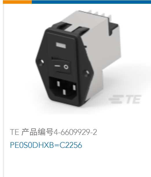
TE 产品编号4-6609929-2 PEOS0DHXB=C2256