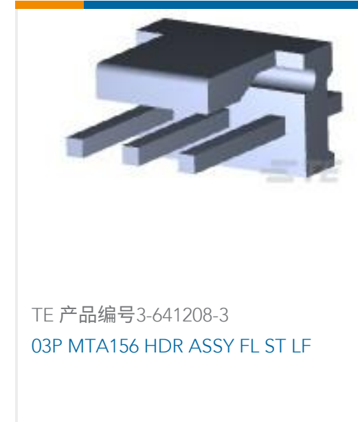
TE 产品编号3-641208-3 03P MTA156 HDR ASSY FL ST LF