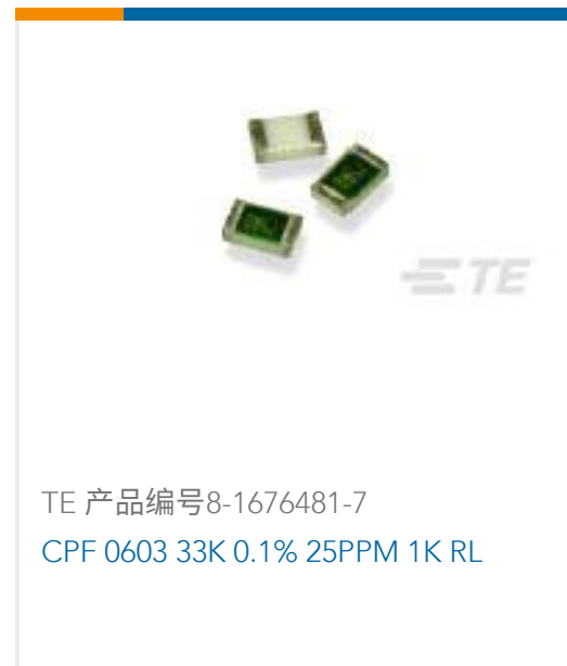
TE 产品编号8-1676481-7 CPF 0603 33K 0.1% 25PPM 1K RL