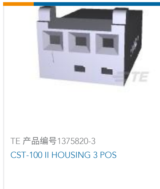
TE 产品编号1375820-3 CST-100 II HOUSING 3 POS