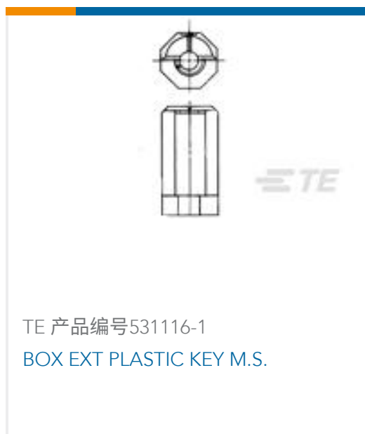
TE 产品编号531116-1 BOX EXT PLASTIC KEY M.S.