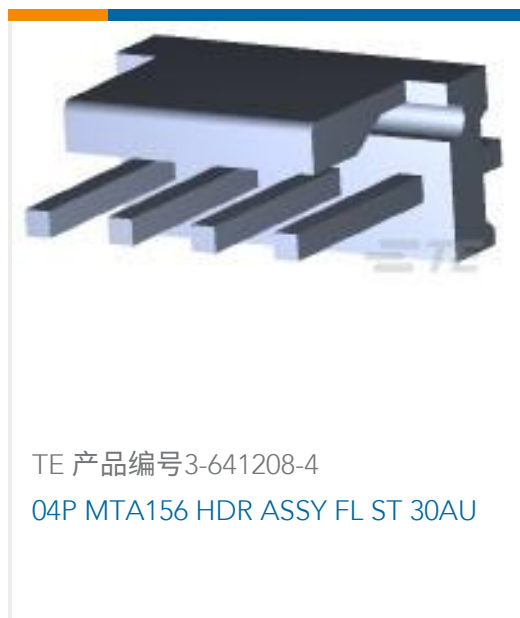
TE 产品编号3-641208-4 04P MTA156 HDR ASSY FL ST 30AU