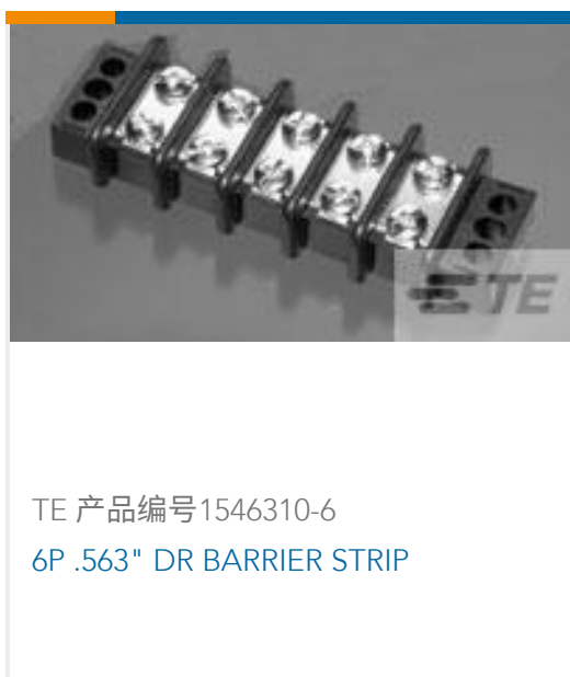
TE 产品编号1546310-6 6P .563" DR BARRIER STRIP