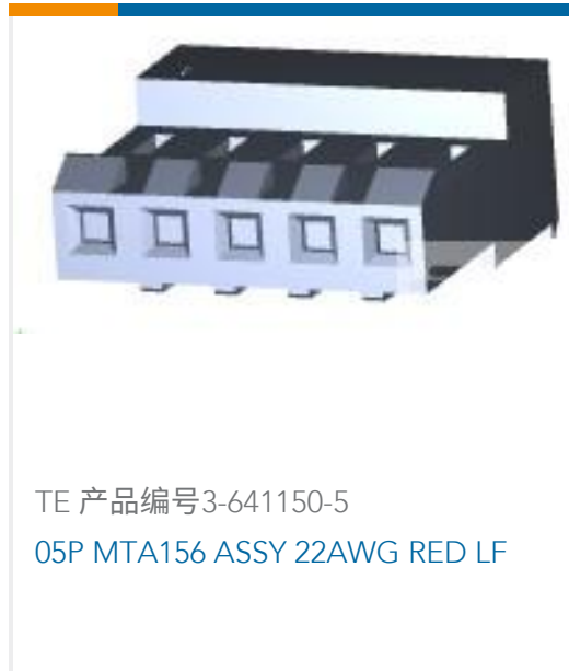
TE 产品编号3-641150-5 05P MTA156 ASSY 22AWG RED LF