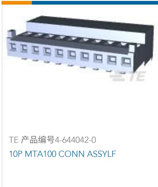
TE 产品编号4-644042-0 10P MTA100 CONN ASSY LF