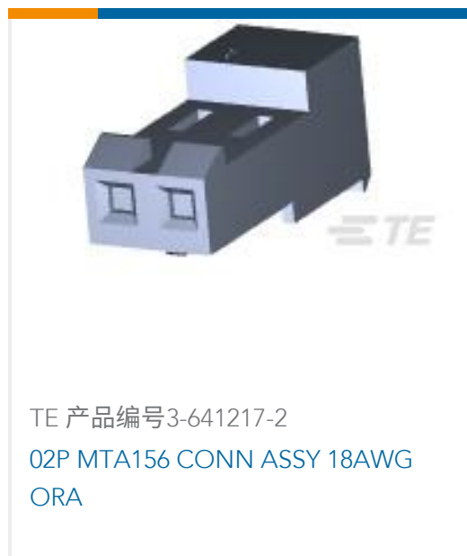
TE 产品编号3-641217-2 02P MTA156 CONN ASSY 18AWG ORA