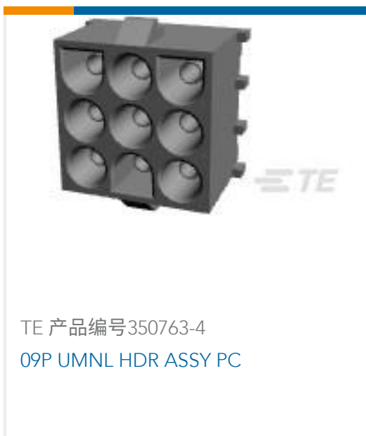
TE 产品编号350763-4 09P UMNL HDR ASSY PC