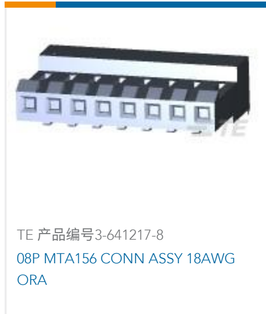
TE 产品编号3-641217-8 08P MTA156 CONN ASSY 18AWG ORA