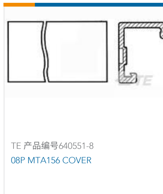
TE 产品编号640551-8 08P MTA156 COVER