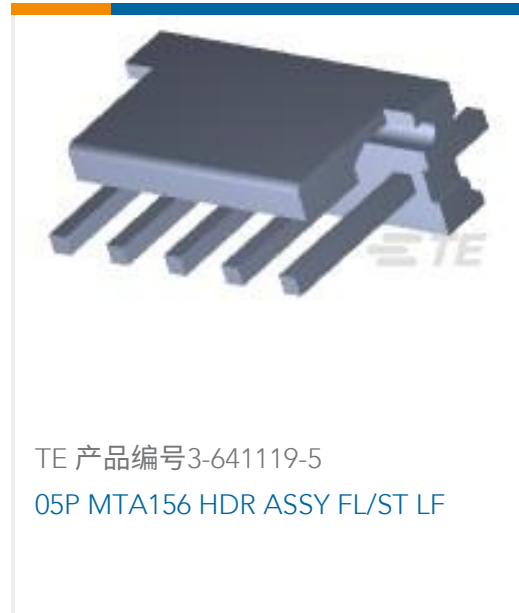
TE 产品编号3-641119-5 05P MTA156 HDR ASSY FL/ST LF