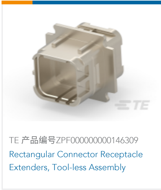
TE 产品编号ZPF000000000146309 Rectangular Connector Receptacle Extenders, Tool-less Assembly