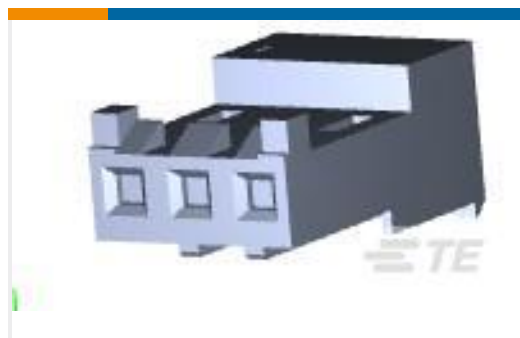
TE 产品编号3-643817-3 03P MTA156 CONN ASSY 18AWG ORA