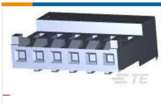
TE 产品编号3-643817-6 06P MTA156 CONN ASSY 18AWG ORA