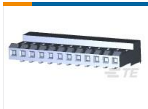
TE 产品编号4-640426-2 12P MTA156 CONN ASSY 18AWG ORA