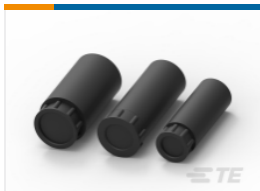
TE 产品编号54123-1 CPC Heat Shrink Strain Reliefs