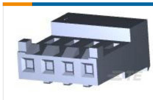
TE 产品编号3-643817-4 04P MTA156 CONN ASSY 18AWG ORA