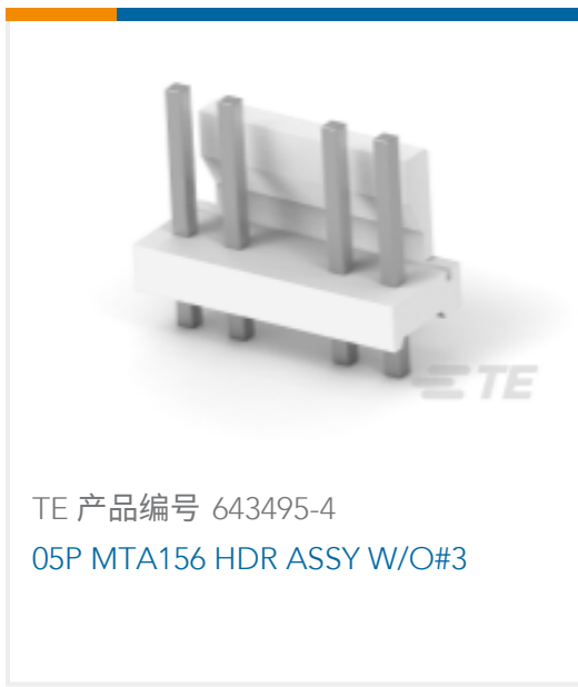
TE 产品编号 643495-4 05P MTA156 HDR ASSY W/O#3