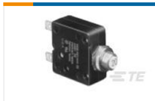
TE 产品编号1-1393249-1 W58-XB1A4A-2=W58