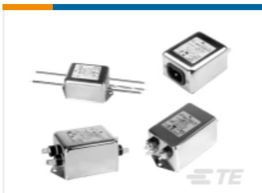
TE 产品编号6609032-9 Single Phase Filters, Corcom R Series