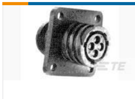
TE 产品编号206430-1 RECPT, SZ 11-4, CPC