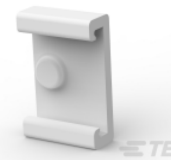
TE 产品编号 640643-2 02P MTA156 COVER F/T