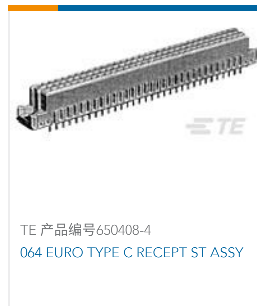
TE 产品编号650408-4 064 EURO TYPE C RECEPT ST ASSY