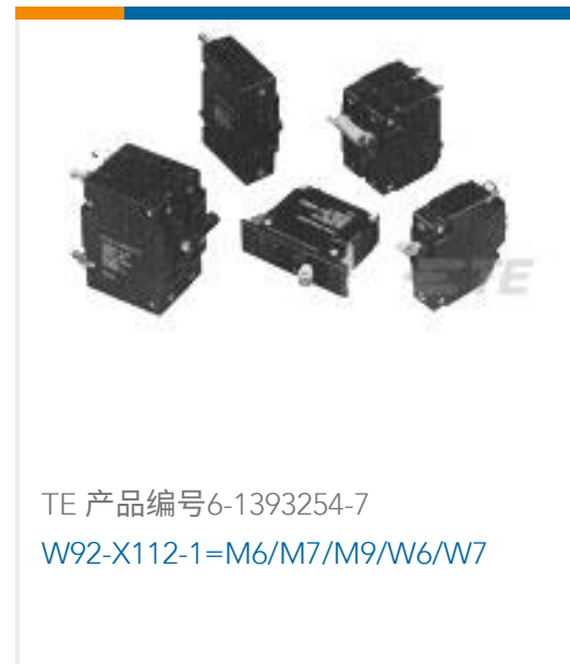
TE 产品编号6-1393254-7 W92-X112-1=M6/M7/M9/W6/W7