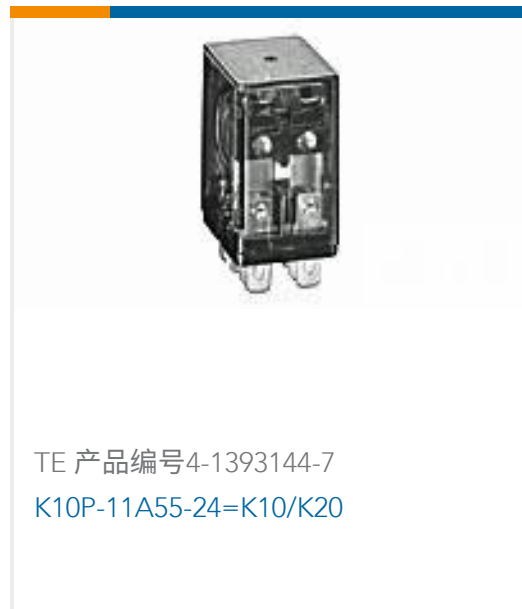
TE 产品编号4-1393144-7 K10P-11A55-24=K10/K20