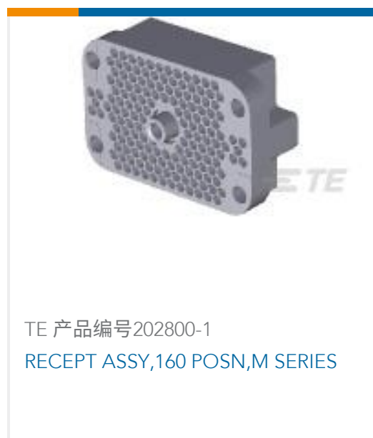
TE 产品编号202800-1 RECEPT ASSY,160 POSN,M SERIES