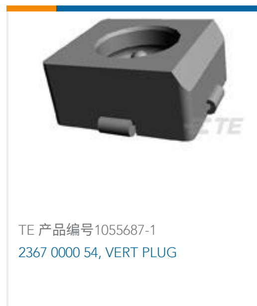
TE 产品编号1055687-1 2367 0000 54, VERT PLUG