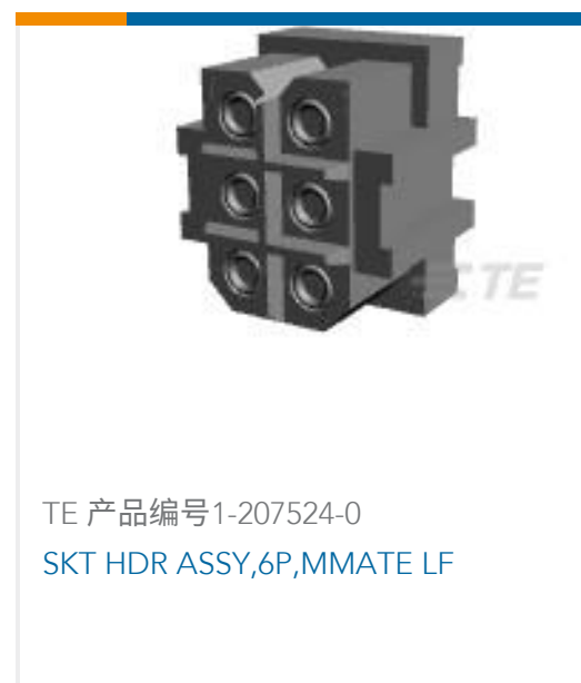
TE 产品编号1-207524-0 SKT HDR ASSY,6P,MMATE LF