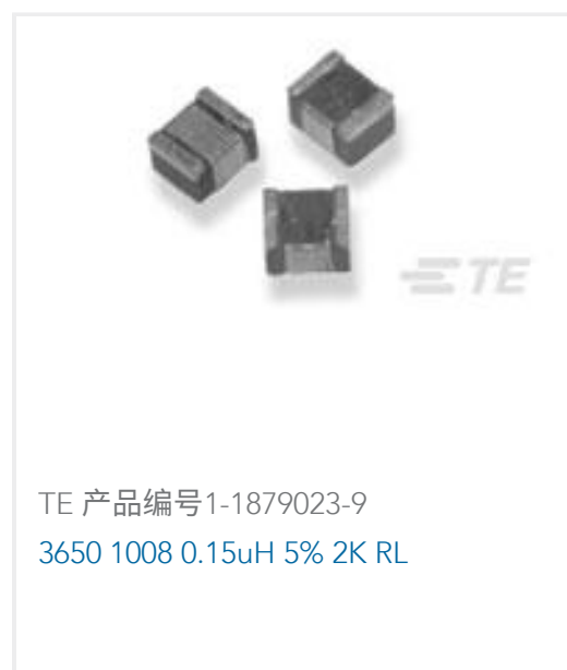
TE 产品编号1-1879023-9 3650 1008 0.15uH 5% 2K RL