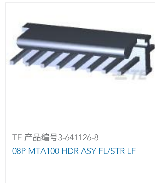
TE 产品编号3-641126-8 08P MTA100 HDR ASY FL/STR LF