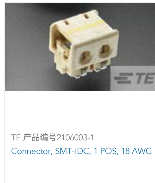
TE 产品编号2106003-1 Connector, SMT-IDC, 1 POS, 18 AWG