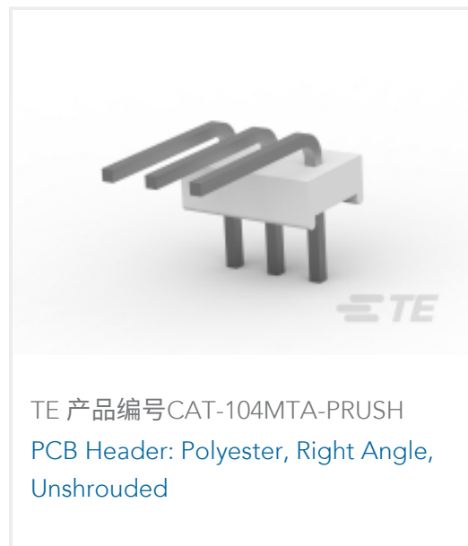
TE 产品编号CAT-104MTA-PRUSH PCB Header: Polyester, Right Angle, Unshrouded