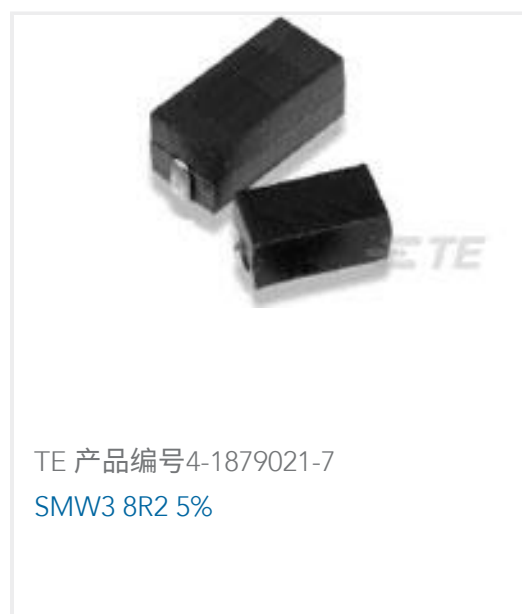
TE 产品编号4-1879021-7 SMW3 8R2 5%