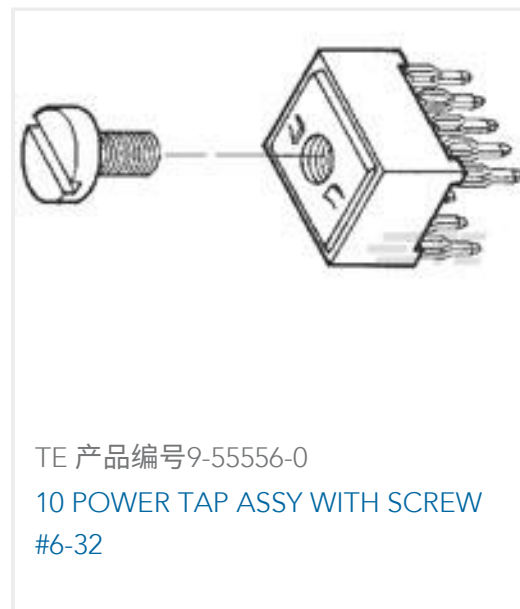
TE 产品编号9-55556-0 10 POWER TAP ASSY WITH SCREW #6-32