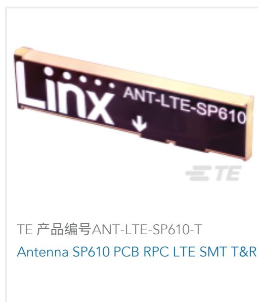
TE 产品编号ANT-LTE-SP610-T Antenna SP610 PCB RPC LTE SMT T&R