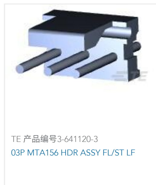
TE 产品编号3-641120-3 03P MTA156 HDR ASSY FL/ST LF