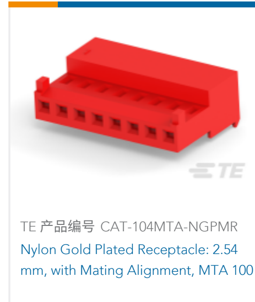
TE 产品编号 CAT-104MTA-NGPMP Nylon Gold Plated Receptacle: 2.54 mm, with Mating Alignment, MTA 100