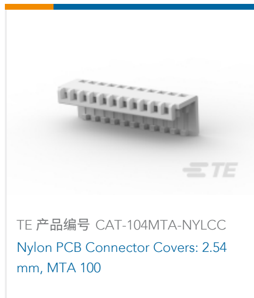
TE 产品编号 CAT-104MTA-NYLCC Nylon PCB Connector Covers: 2.54 mm, MTA 100