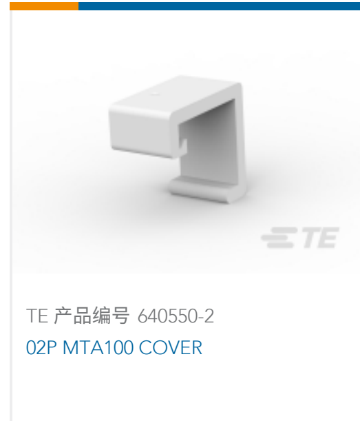
TE 产品编号 640550-2 02P MTA100 COVER