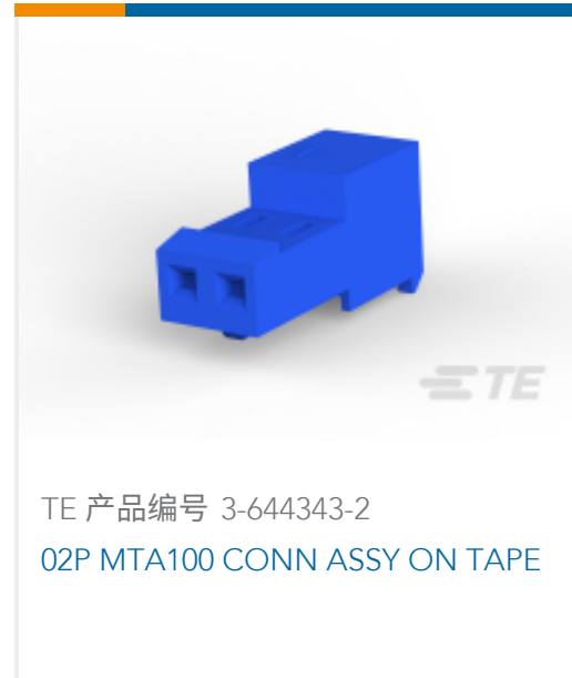
TE 产品编号 3-644343-2 02P MTA100 CONN ASSY ON TAPE