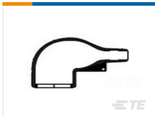
TE 产品编号EF9981-000 222K121-25L/225-0