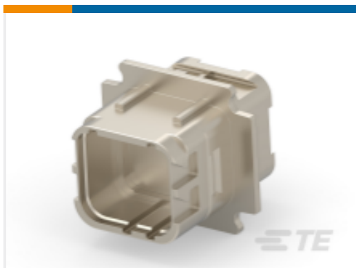
TE 产品编号ZPF000000000146309 Rectangular Connector Receptacle Extenders, Tool-less Assembly