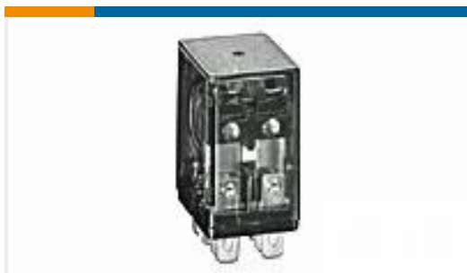
TE 产品编号4-1393144-0 K10P-11A15-120=K10/K20