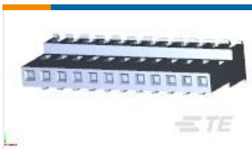
TE 产品编号4-640608-2 12P MTA156 CONN ASSY 26AWG LF