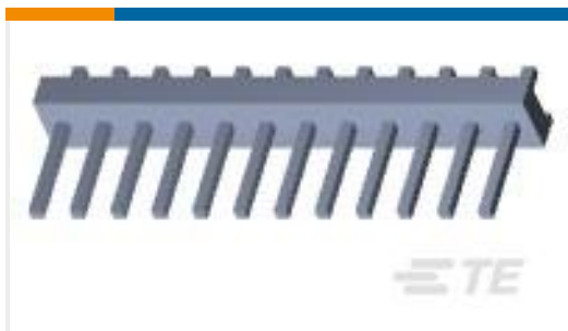
TE 产品编号1-640383-2 12P MTA156 HDR ASSY STR SQ SN