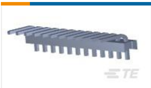
TE 产品编号1-640385-2 12P MTA156 HDR ASSY SQ R/A