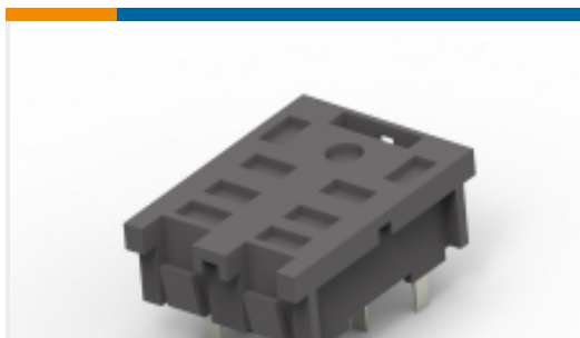
TE 产品编号2-1419106-1 27E489=SOCKET,K10,8,PCB,NYL