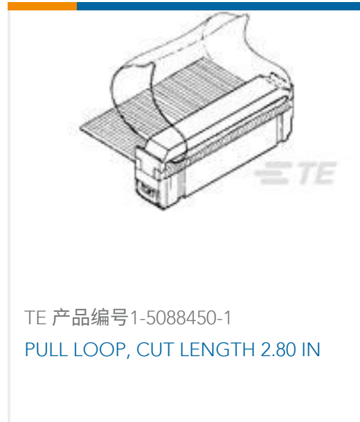
TE 产品编号1-5088450-1 PULL LOOP, CUT LENGTH 2.80 IN