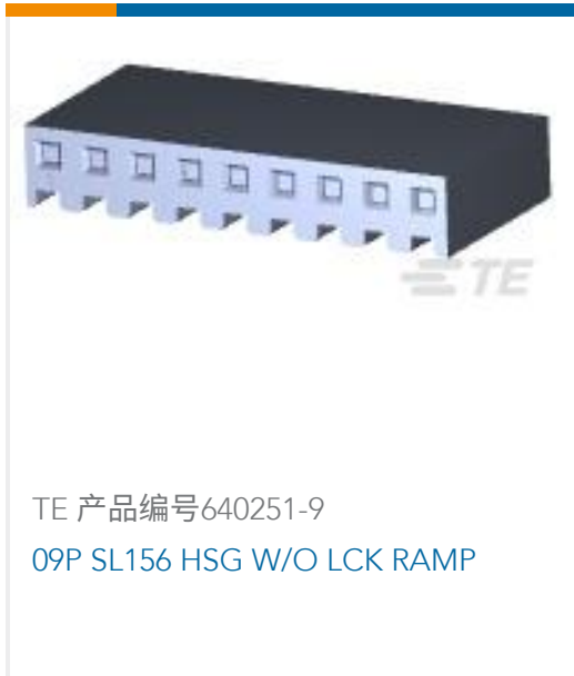
TE 产品编号640251-9 09P SL156 HSG W/O LCK RAMP