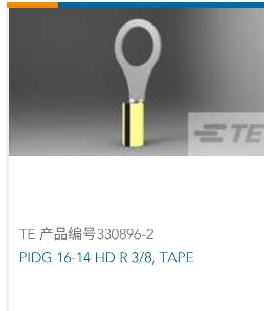
TE 产品编号330896-2 PIDG 16-14 HD R 3/8, TAPE