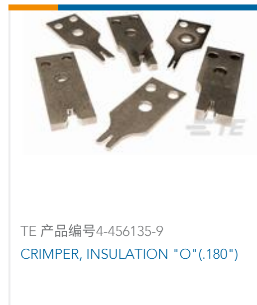
TE 产品编号4-456135-9 CRIMPER, INSULATION "O" (.180)