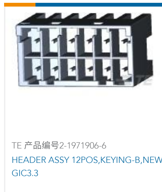
TE 产品编号2-1971906-6 HEADER ASSY 12POS,KEYING-B,NEW GIC3.3