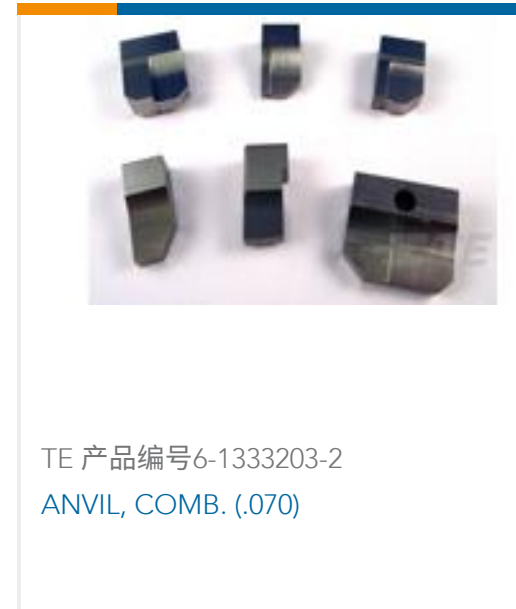
TE 产品编号6-1333203-2 ANVIL, COMB. (.070)