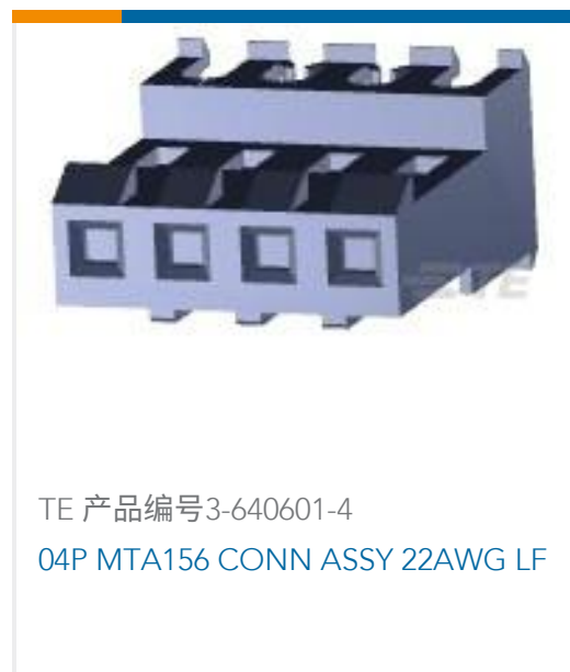
TE 产品编号3-640601-4 04P MTA156 CONN ASSY 22AWG LF