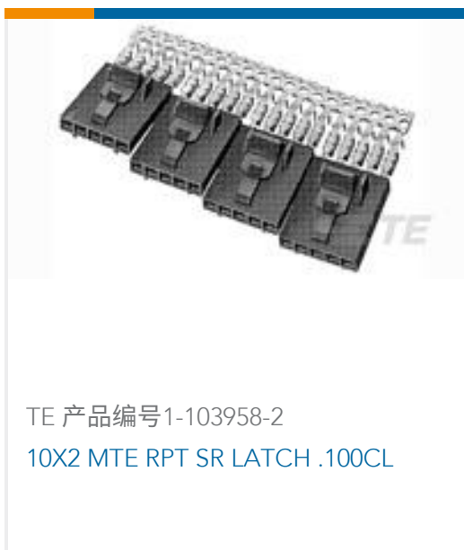
TE 产品编号1-103958-2 10X2 MTE RPT SR LATCH .100CL