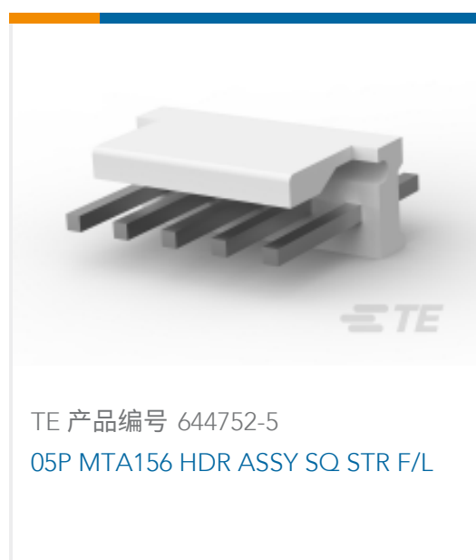
TE 产品编号 644752-5 05P MTA156 HDR ASSY SQ STR F/L