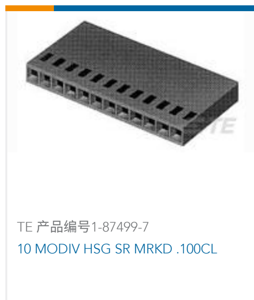
TE 产品编号1-87499-7 10 MODIV HSG SR MRKD .100CL