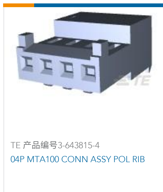
TE 产品编号3-643815-4 04P MTA100 CONN ASSY POL RIB