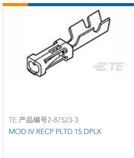
TE 产品编号2-87523-3 MOD IV RECP PLTD 15 DPLX