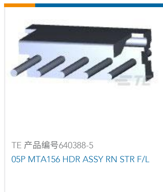
TE 产品编号640388-5 05P MTA156 HDR ASSY RN STR F/L