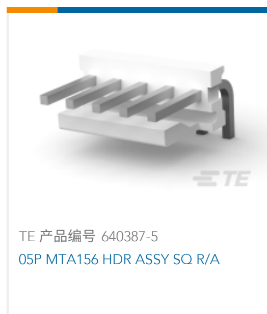
TE 产品编号 640387-5 05P MTA156 HDR ASSY SQ R/A