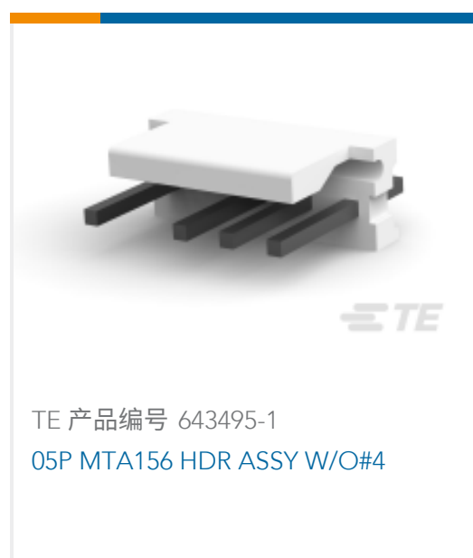
TE 产品编号 643495-1 05P MTA156 HDR ASSY W/O#4