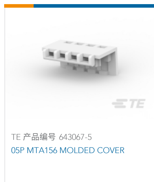
TE 产品编号 643067-5 05P MTA156 MOLDED COVER