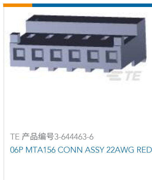
TE 产品编号3-644463-6 06P MTA156 CONN ASSY 22AWG RED