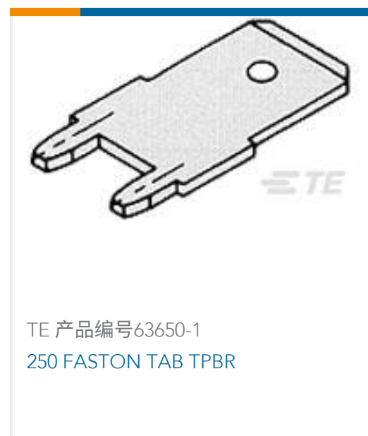
TE 产品编号63650-1 250 FASTON TAB TPBR