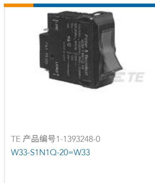
TE 产品编号1-1393248-0 W33-S1N1Q-20=W33