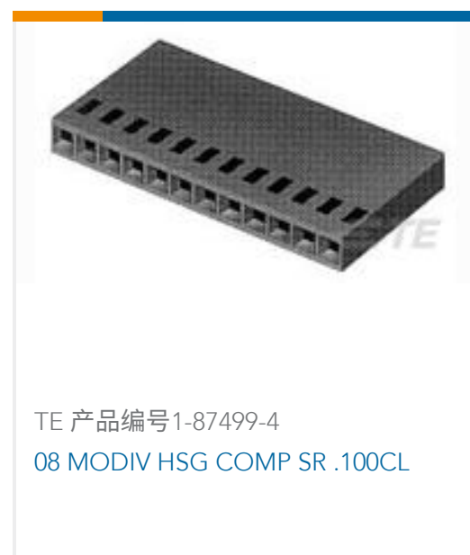
TE 产品编号1-87499-4 08 MODIV HSG COMP SR .100CL