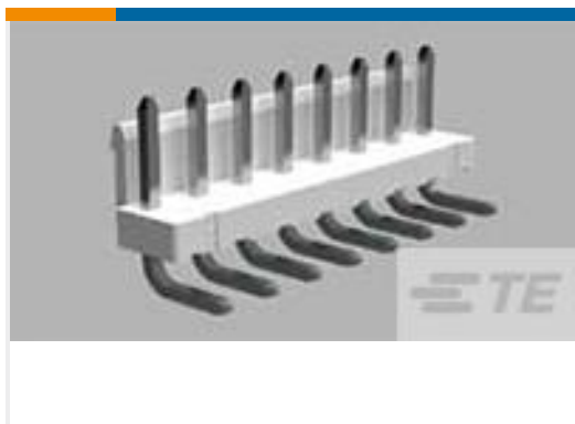
TE 产品编号1744428-8 3.96 EP HDR ASSY 8P R/A, GW