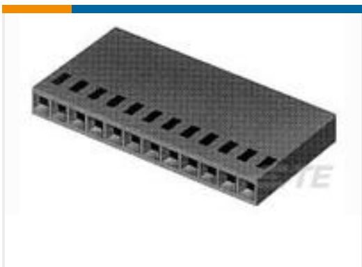
TE 产品编号2-87499-6 14 MODIV HSG COMP SR .100CL