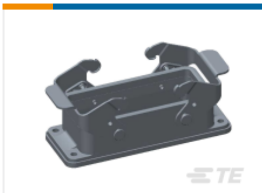
TE 产品编号T1410162000-100 H16B-AG