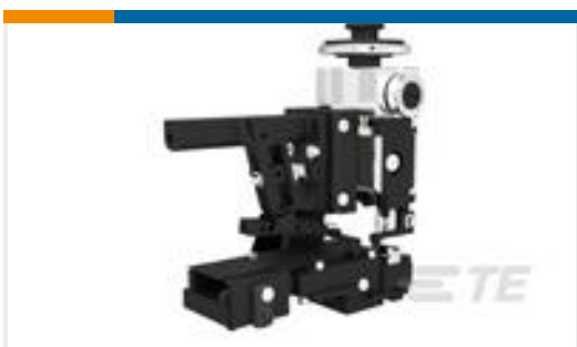
TE 产品编号2266143-1 OCEAN_2.0_Applicator-S-050F0700