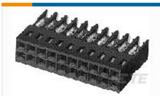
TE 产品编号5-102448-3 10 AMPMODU MT ASSY DR.100CL SN