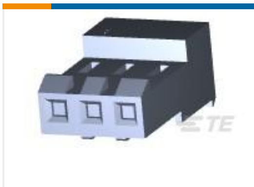
TE 产品编号3-640430-3 03P MTA156 CONN ASSY 26AWG BLU