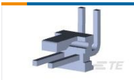
TE 产品编号3-644755-2 02P MTA156 HDR ASSY SQ RARB F/L