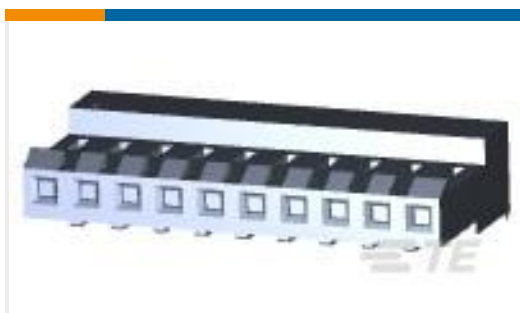
TE 产品编号4-640430-0 10P MTA156 CONN ASSY 26AWG BLU