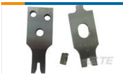
TE 产品编号7-2266143-7 OCEAN_2.0_SPARE_PART_KIT- 050F0700