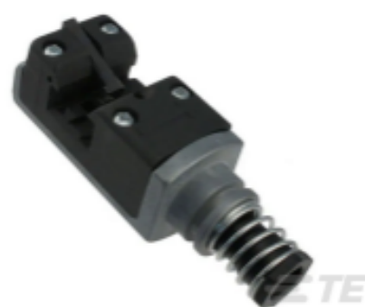
TE 产品编号 58247-1 MTA 156 CRIMP HEAD REPAIR DISCRETE