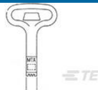
TE 产品编号 59804-1 MAINTENANCE TOOL