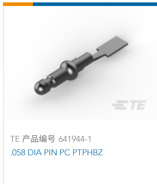
TE 产品编号 641944-1 .058 DIA PIN PC PTPHBZ