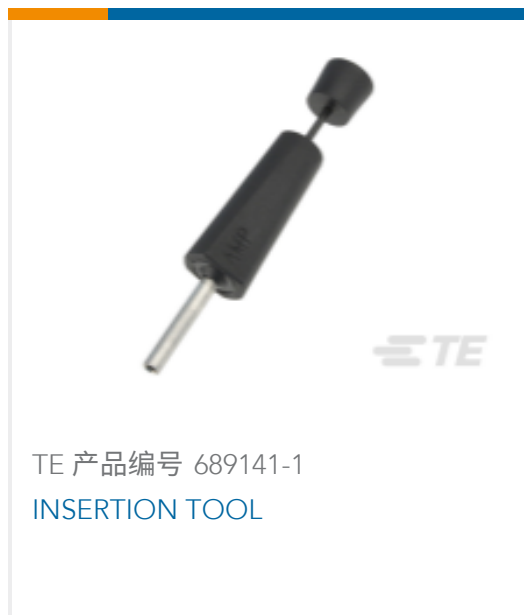
TE 产品编号 689141-1 INSERTION TOOL