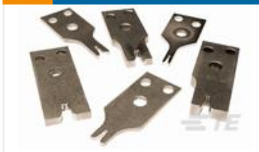
TE 产品编号7-683454-8 CRIMPER, INSULATION "O"(.080")