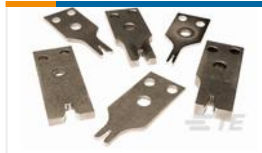
TE 产品编号1-562108-5 CRIMPER WIRE