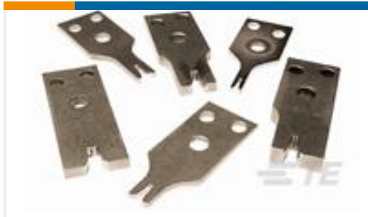
TE 产品编号1-456402-7 CRIMPER WIRE .055 F