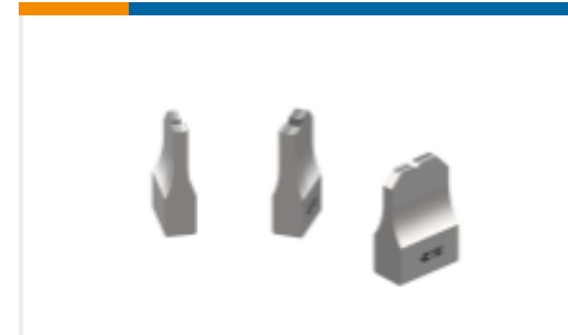
ANVIL REPRESENTATION ONLY 3000