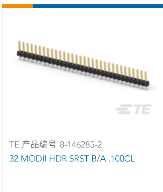
TE 产品编号 8-146285-2 32 MODII HDR SRST B/A .100CL