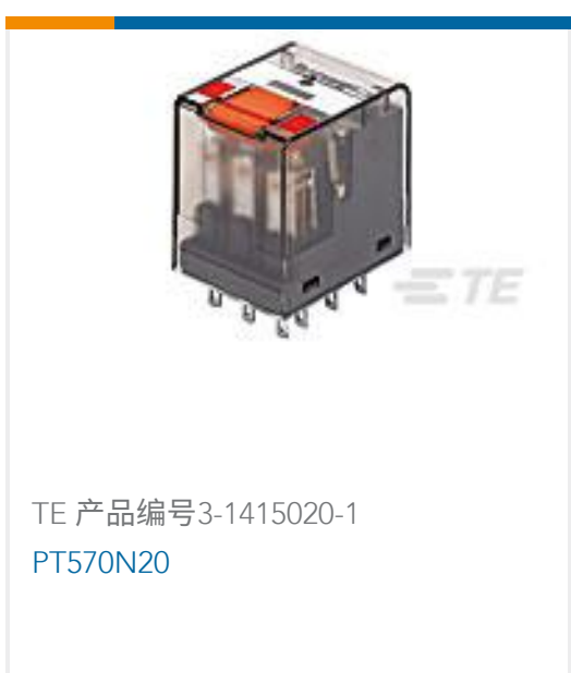
TE 产品编号3-1415020-1 PT570N20