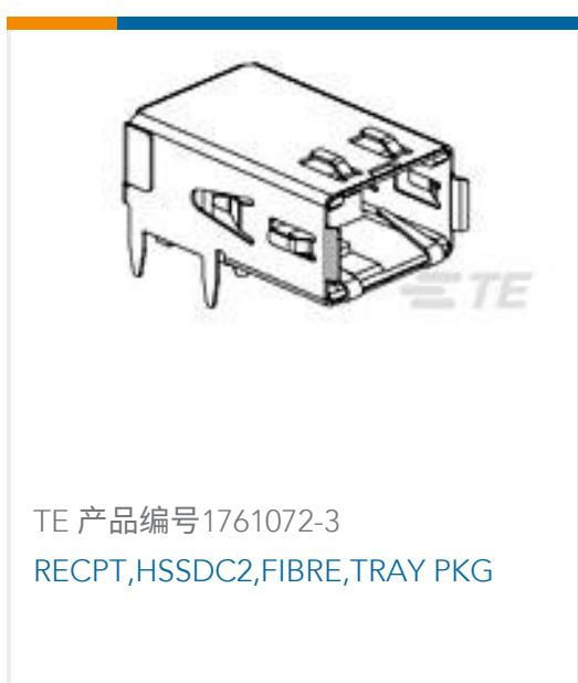
TE 产品编号1761072-3 RECPT, HSSDC2, FIBRE, TRAY PKG