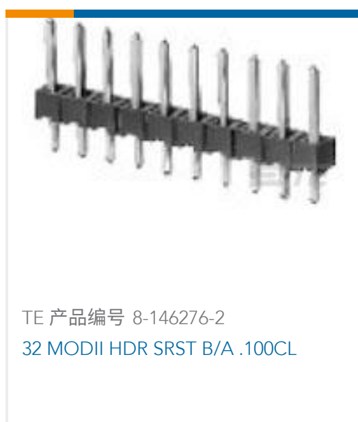
TE 产品编号 8-146276-2 32 MODII HDR SRST B/A .100CL