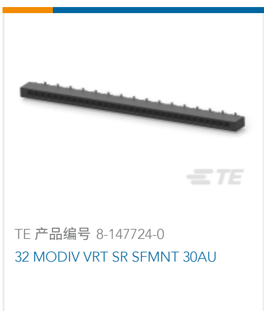
TE 产品编号 8-147724-0 32 MODIV VRT SR SFMNT 30AU