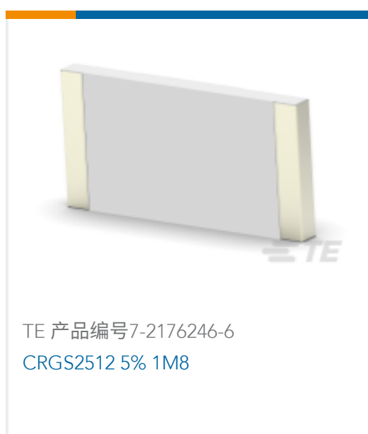
TE 产品编号7-2176246-6 CRGS2512 5% 1M8