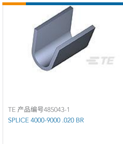
TE 产品编号485043-1 SPLICE 4000-9000 .020 BR