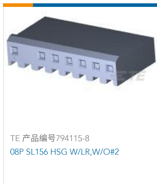
TE 产品编号794115-8 08P SL156 HSG W/LR,W/O#2