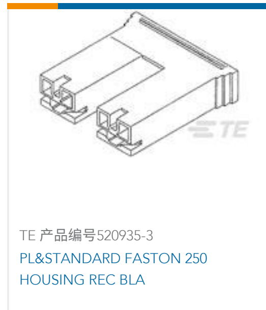
TE 产品编号520935-3 PL&STANDARD FASTON 250 HOUSING REC BLA