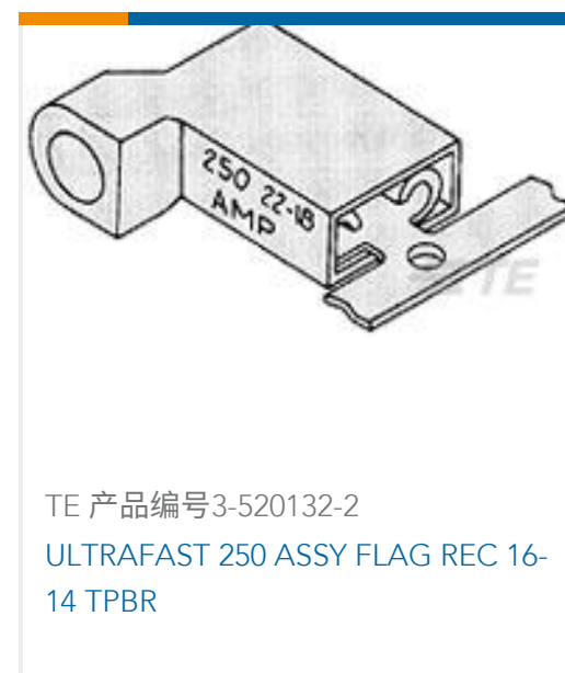
TE 产品编号3-520132-2 ULTRAFast 250 ASSY FLAG REC 16-14 TPBR