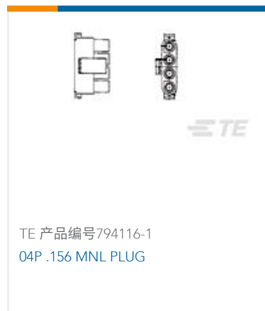
TE 产品编号794116-1 04P .156 MNL PLUG