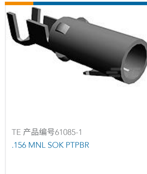
TE 产品编号61085-1 .156 MNL SOK PTPBR