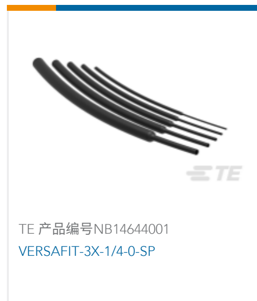
TE 产品编号NB14644001 VERSAFIT-3X-1/4-0-SP