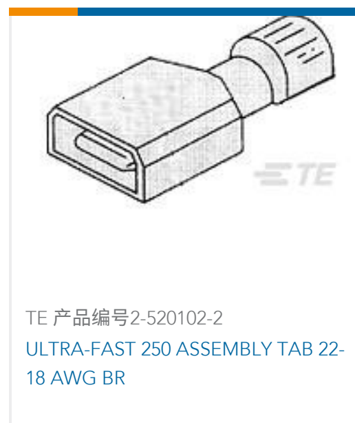
TE 产品编号2-520102-2 ULTRA-FAST 250 ASSEMBLY TAB 22-18 AWG BR