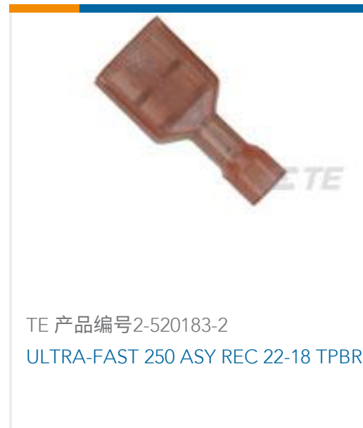
TE 产品编号2-520183-2 ULTRA-FAST 250 ASY REC 22-18 TPBR