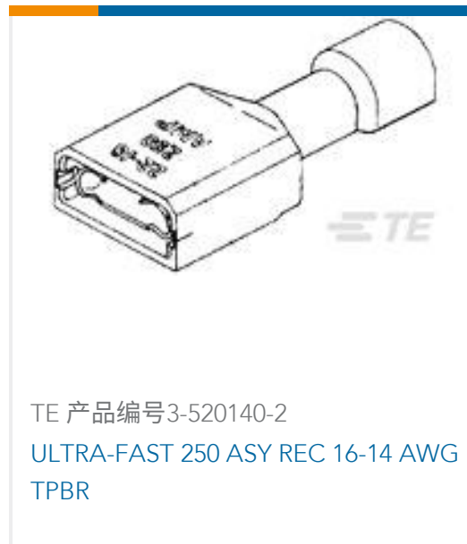
TE 产品编号3-520140-2 ULTRA-FAST 250 ASY REC 16-14 AWG TPBR