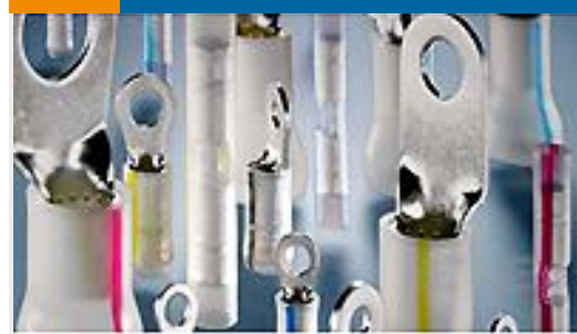
TE 产品编号696423-3 TERMINAL,PIDG PVF2 R,16-14, 6