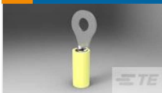
TE 产品编号2-326875-1 TERMINAL,PIDG R 26-22 6