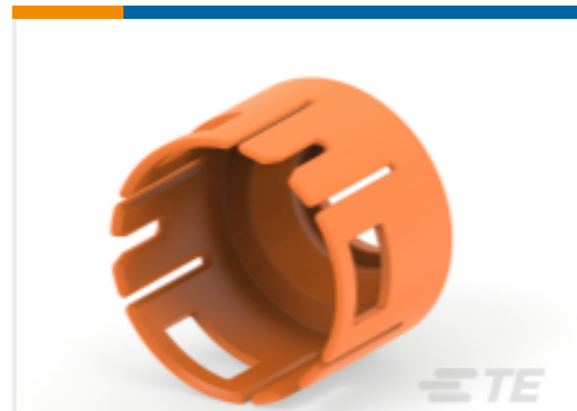
TE 产品编号2399669-1 H&S 70mm, Cable cover