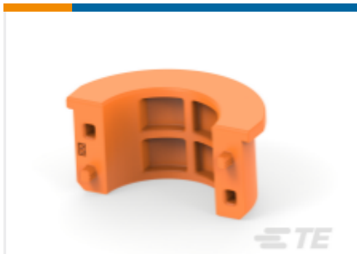
TE 产品编号2399666-1 H&S 70mm, Inner spacer