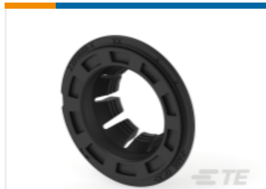
TE 产品编号2399668-1 H&S 70mm, Cable clip