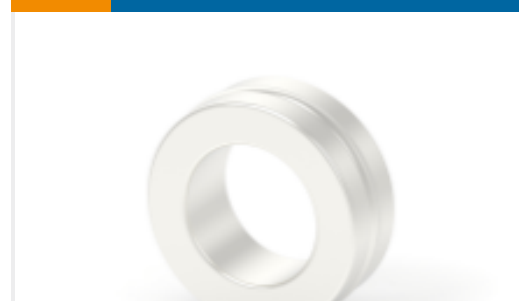
TE 产品编号2387549-1 CU ALLOY,INNER FERRULE,70SQ