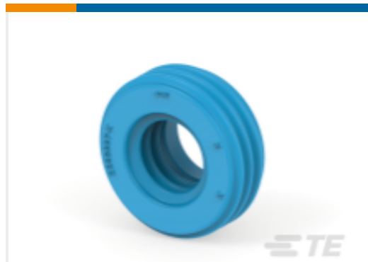
TE 产品编号2399667-1 H&S 70mm, SWS