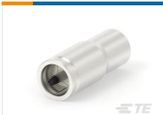
TE 产品编号2386340-1 DIA 14MM,TERMINAL,FAM SLD /UNSLD,CB