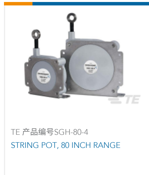
TE 产品编号SGH-80-4 STRING POT, 80 INCH RANGE