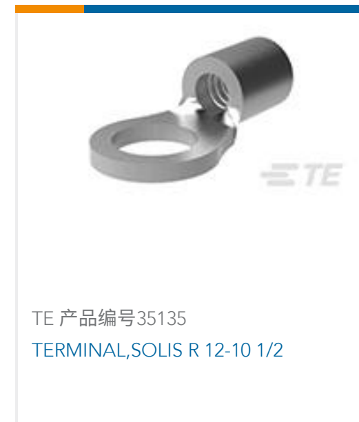
TE 产品编号35135 TERMINAL, SOLIS R 12-10 1/2