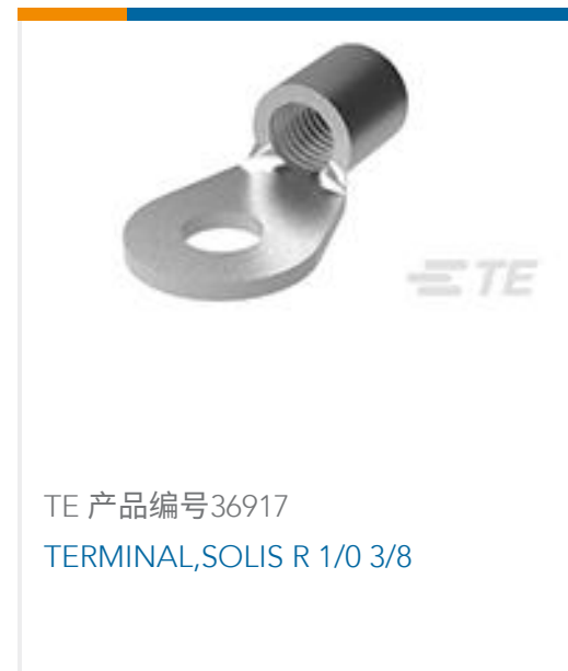
TE 产品编号36917 TERMINAL, SOLIS R 1/0 3/8