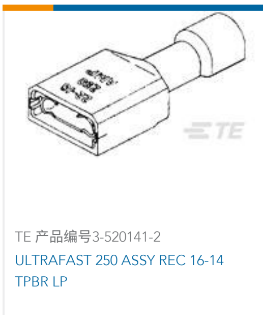
TE 产品编号3-520141-2 ULTRAFast 250 ASSY REC 16-14 TPBR LP