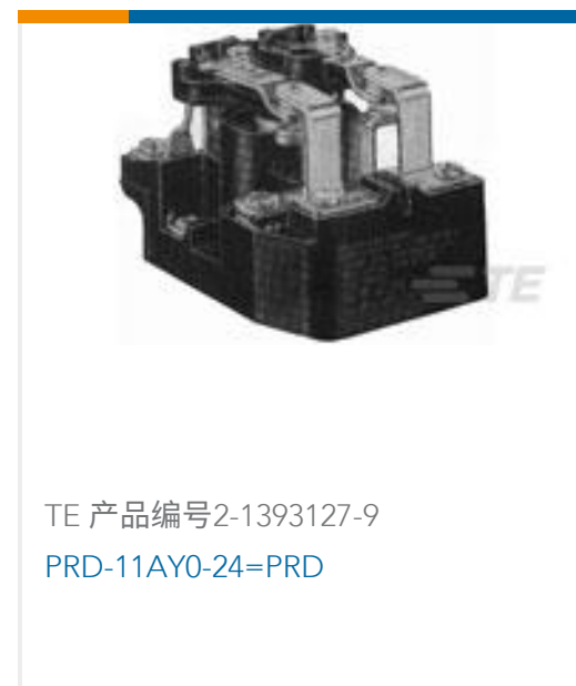
TE 产品编号2-1393127-9 PRD-11AY0-24=PRD