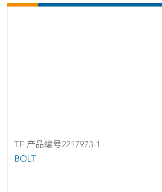
TE 产品编号2217973-1 BOLT