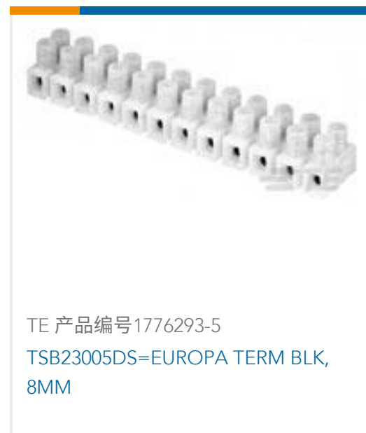
TE 产品编号1776293-5 TSB23005DS=EUROPA TERM BLK, 8MM