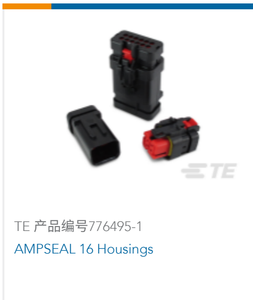
TE 产品编号776495-1 AMPSEAL 16 Housings