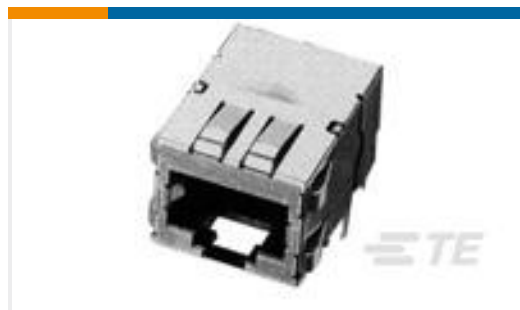
TE 产品编号1734509-4 RJ45,8P8C,W/LED,G/Y,50u"