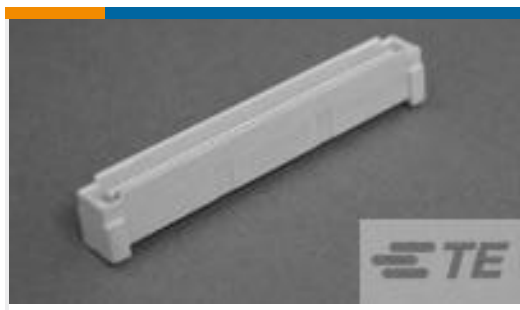
TE 产品编号3-5177986-1 0.8FH,P08H.5,040,08/Sn,TR,SC