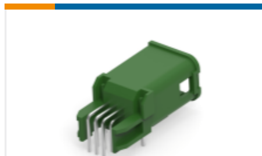
TE 产品编号2321376-5 6POS,TAB0.5X0.4,HDR ASSY,90DEG, COD E