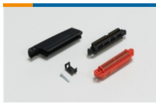
IDC D-Sub 连接器(6)