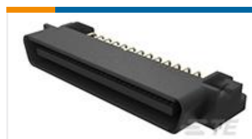
TE 产品编号3-5175472-1 CHAMP 050 B-T-B PLUG H W/LEG 20P