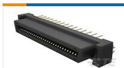
TE 产品编号3-5175475-8 CHAMP 050 B/B REC V W/LEG 68P