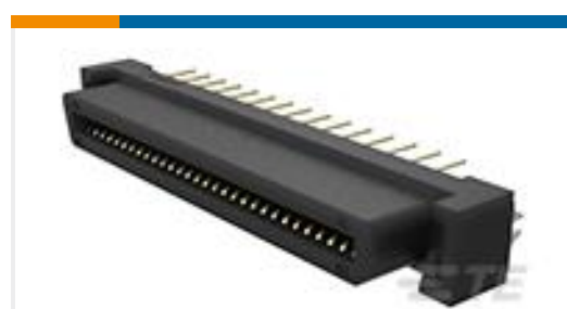
TE 产品编号3-5175475-5 CHAMP 050 B/B REC V W/LEG 40P