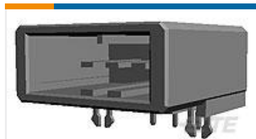
TE 产品编号9-2013519-0 DYNAMIC D3900 H-HDR ASSY 7/10P Z TYPE-A