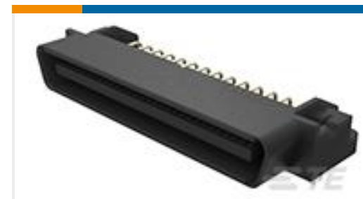
TE 产品编号3-5175472-5 CHAMP 050 B/B PLUG H W/LEG 40P