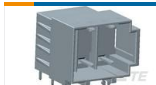
TE 产品编号2229806-1 D3950 HDR 6POS 2ROW TYPE-A