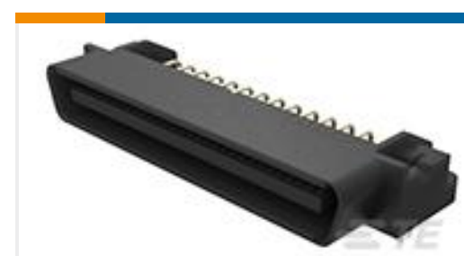
TE 产品编号3-5175472-8 CHAMP 050 B/B PLUG H W/LEG 68P