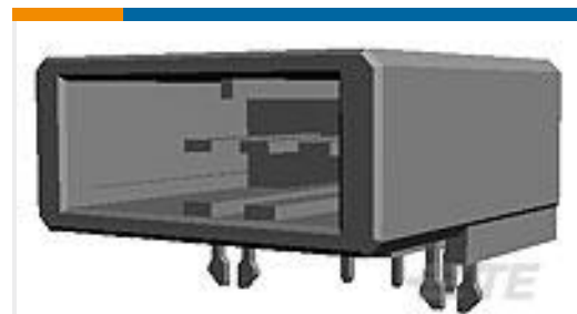
TE 产品编号2-2013519-0 DYNAMIC D3900 H-HDR ASSY 10P Y TYPE-A