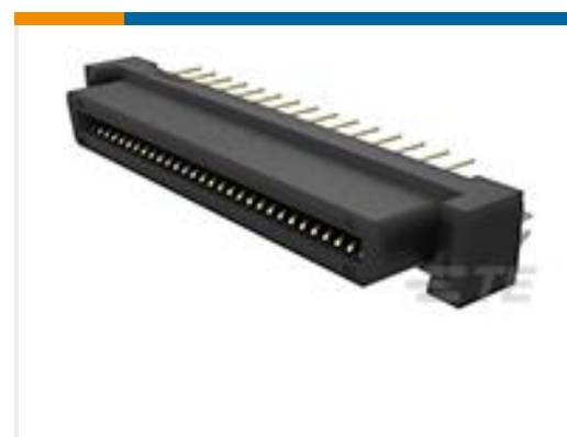
TE 产品编号3-5175475-8 CHAMP 050 B/B REC V W/LEG 68P