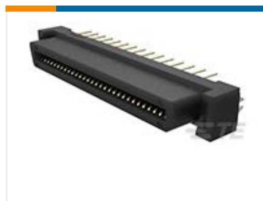
TE 产品编号3-5175475-7 CHAMP 050 B/B REC V W/LEG 60P