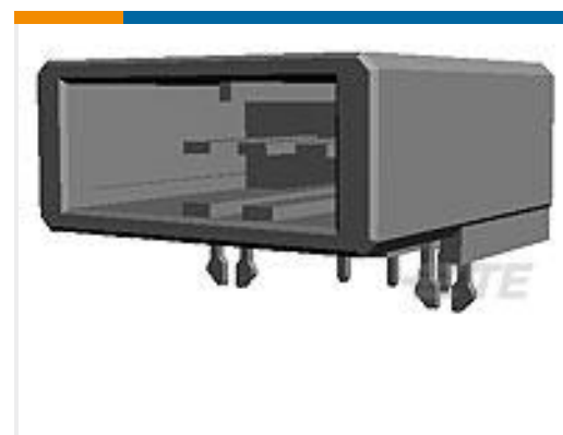
TE 产品编号2-2013519-0 DYNAMIC D3900 H-HDR ASSY 10P Y TYPE-A