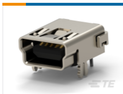
TE 产品编号2342993-1 MINI USB CONN, RCPT, R/A, DIP, B TYPE