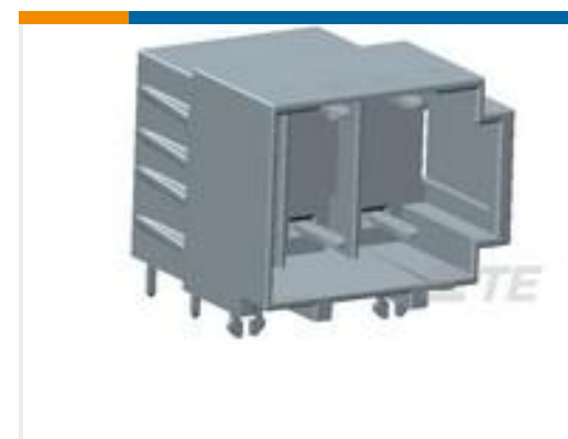
TE 产品编号2229806-1 D3950 HDR 6POS 2ROW