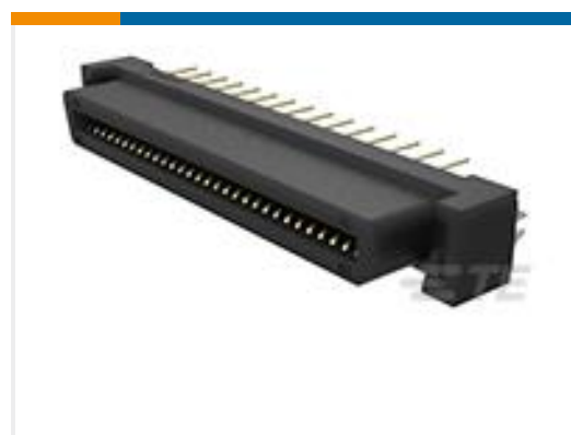
TE 产品编号3-5175475-5 CHAMP 050 B/B REC V W/LEG 40P