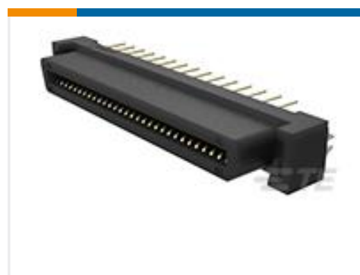
TE 产品编号3-5175475-1 CHAMP 050 B-T-B REC V W/LEG