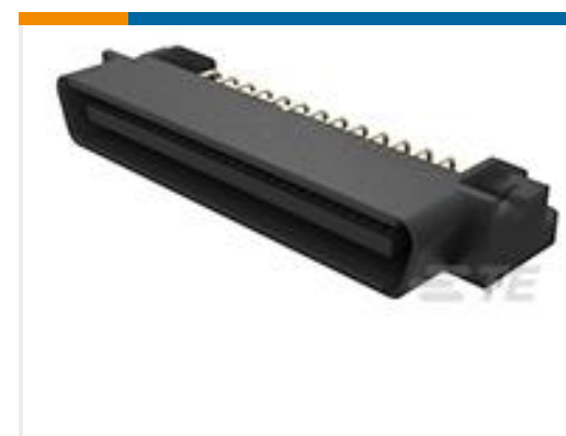
TE 产品编号3-5175472-8 CHAMP 050 B/B PLUG H W/LEG 68P