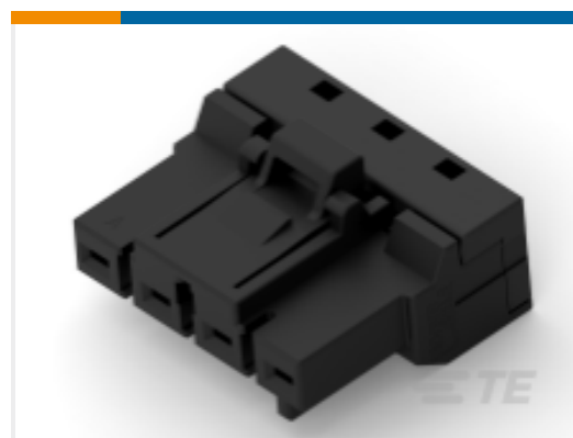
TE 产品编号1-2331743-4 D3950 REC 4POS 1ROW X KEY MARKED