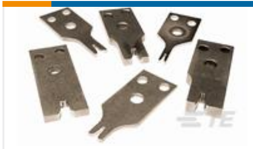
TE 产品编号1213077-9 CRIMPER, INSULATION "F" .086