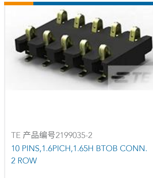
TE 产品编号2199035-2 10 PINS, 1.6PICH, 1.65H BTOB CONN. 2 ROW