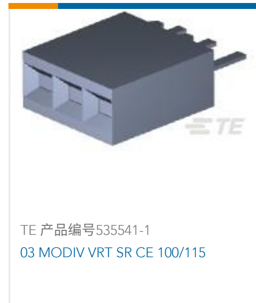
TE 产品编号535541-1 03 MODIV VRT SR CE 100/115