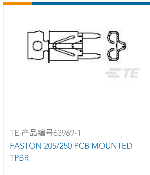
TE 产品编号63969-1 FASTON 205/250 PCB MOUNTED TPBR