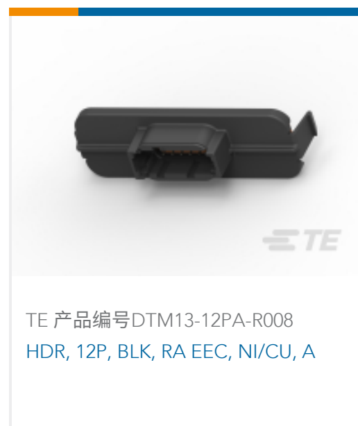
TE 产品编号DTM13-12PA-R008 HDR, 12P, BLK, RA EEC, NI/CU, A