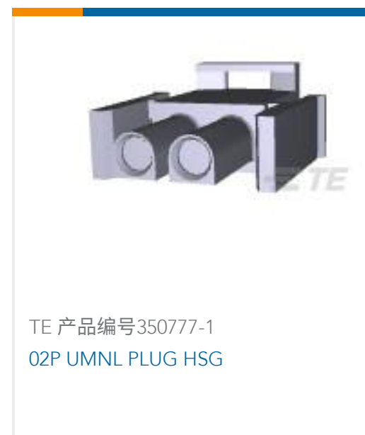
TE 产品编号350777-1 02P UMNL PLUG HSG