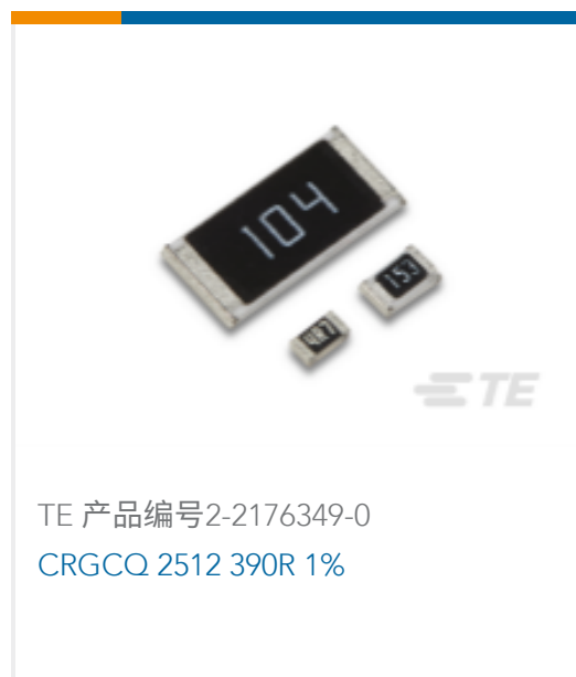
TE 产品编号2-2176349-0 CRGCO 2512 390R 1%