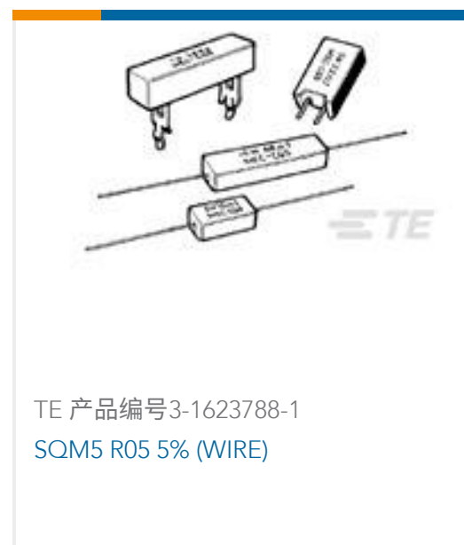
TE 产品编号3-1623788-1 SQM5 R05 5% (WIRE)