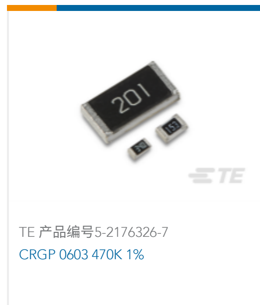
TE 产品编号5-2176326-7 CRGP 0603 470K 1%