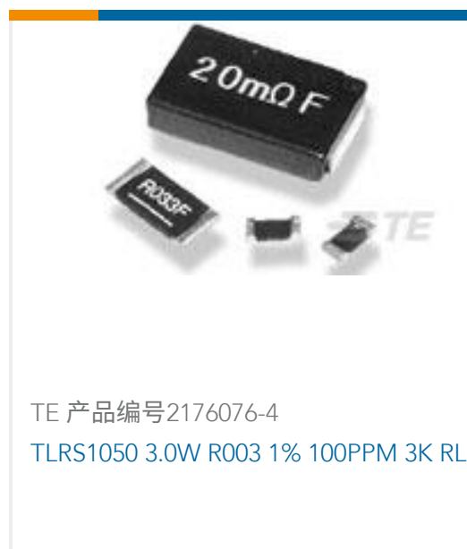
TE 产品编号2176076-4 TLRS1050 3.0W R003 1% 100PPM 3K RL