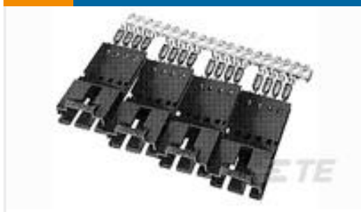
TE 产品编号103944-6 3X7 MTE SHRD PIN SR POL .100CL