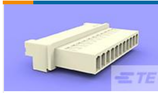
TE 产品编号1-1969589-2 HSG, REC,FREE-HANG,GWT, SINGLE ROW,EP2.5