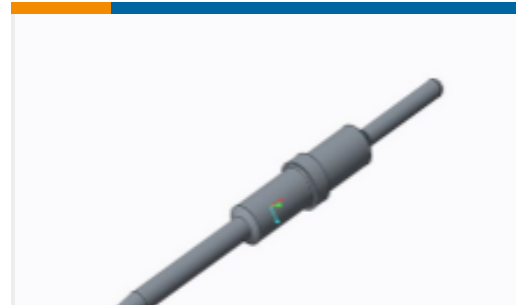
TE 产品编号1-448138-5 CONTACT SZ 20 POSTED PIN