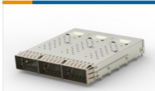
TE 产品编号2170737-4 QSFP28, 1X3, CAGE ASSEMBLY, SPRING