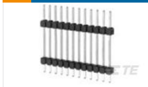
TE 产品编号5-146456-6 06 MODII HDR SRST UNSHRD STKG