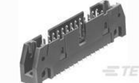
TE 产品编号 2-1761679-9 IDC LOW PRO HDR 26P VERT BLUE