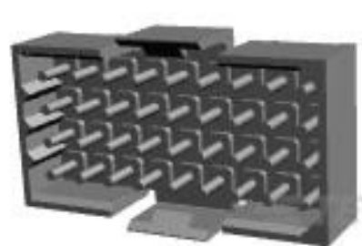
TE 产品编号 1-207121-0 METRIMATE PIN HDR ASY,36P LF