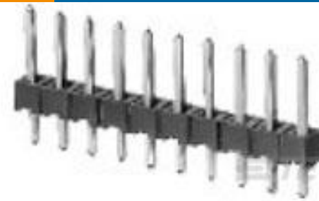
TE 产品编号 5-146276-2 02 MODII HDR SRST B/A .100CL