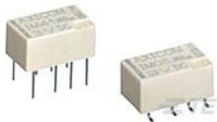
TE 产品编号 1462039-4 IM13GR=IM RELAY 100mW 5V