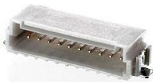
TE 产品编号 292228-3 1.5 MINI CT SGL H SMT W/O BOSS