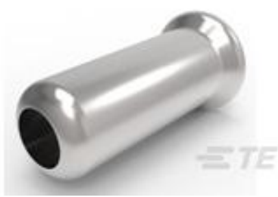
TE 产品编号 3-5331272-9 SOCKET,MIN-SPR W/H SN-AU SER-2