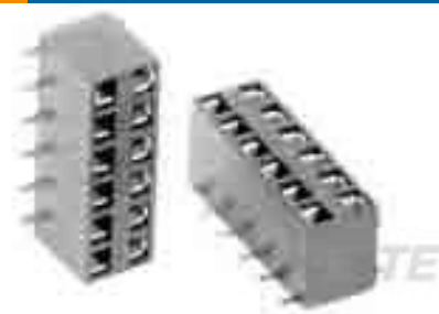
TE 产品编号 969973-4 2x4P HV100 REC. CON, SMD, GOLD, BLISTER