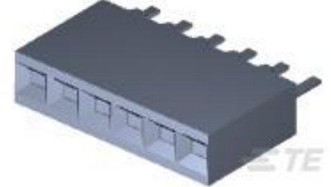
TE 产品编号 5-534237-4 06 MODII VRT SR CE 100/115